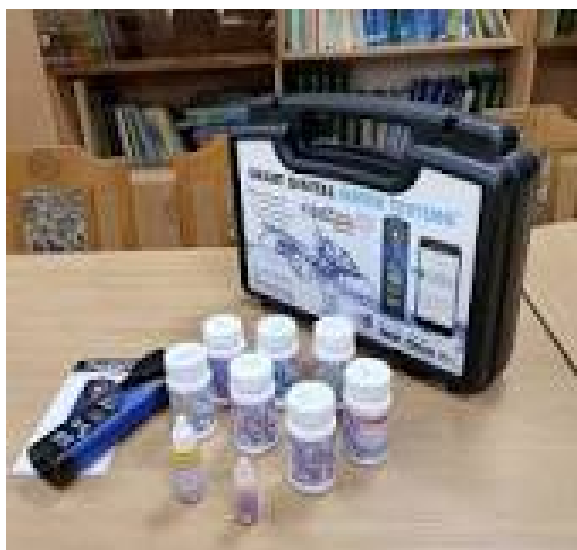
Світлина 9. Прилад для дослідження якості поверхневих вод.

Інструментарій метризації показників поверхневих і підземних вод включає портативні та лабораторні прилади для визначення фізичних, фізико-хімічних і хімічних показників: рН-метр, солемір, оксиметр, кондуктометр (електропровідність), мутномір, фотоколориметр, спектрофотометр, тест-смужки, автоматичні системи титратори.