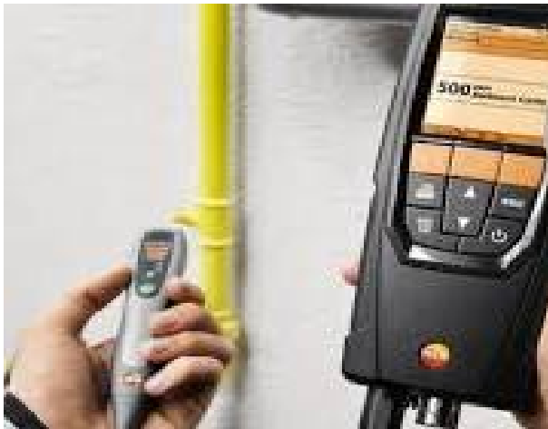
Світлина 2. Газоаналізатор.