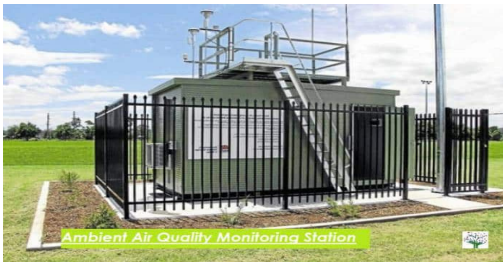
Світлина 7. Автоматизована система моніторингу

Сучасним напрямком метризації атмосферного повітря є автоматизовані системи моніторингу (світлина 7, 8). Стационарні станції; мережі датчиків; інтеграція з веб-додатками, панелями, мобільними додатками. Переваги і проблеми автоматизованих систем моніторингу.