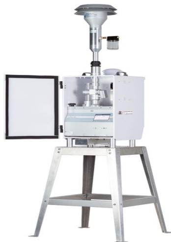
Світлина 6. Безперервні автоматизовані прилади.