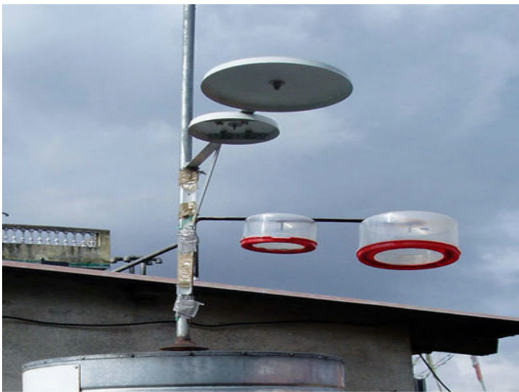
Світлина 5. Безперервні автоматизовані прилади.