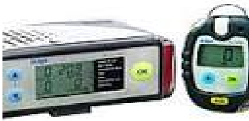
Світлина 1. Газоаналізатор.