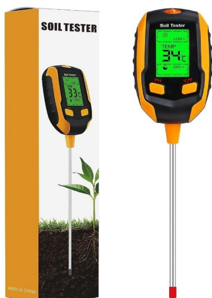
Світлина 11. Вимірювач вологості ґрунту.