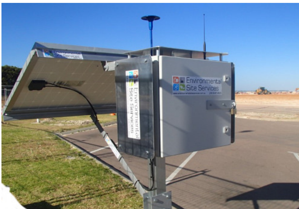
Світлина 8. Автоматизована система моніторингу

Наслідки забруднення атмосферного повітря. Результатами метризації показників атмосферного повітря є: оцінка поточного стану атмосферного повітря, виявлення джерела забруднення, розроблення стратегії управління