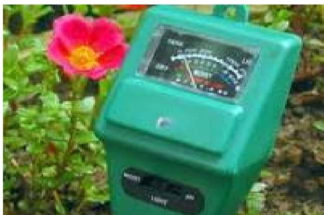
Світлина 12. Аналізатор ґрунту ETP-301.