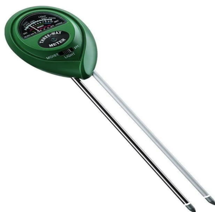
Світлина 10. Аналізатор кислотності рН ґрунту.