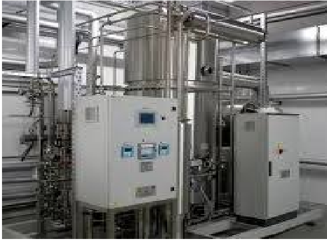
Світлина 4. Фільтраційні проби