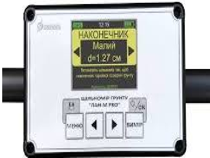
Світлина 13. Щільномір для ґрунту ЛАН-М для PRO з функцією GPS.

Значення метризації ґрунтів для моніторингу стану довкілля.