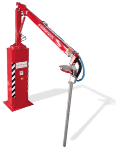
Світлина 3. Пасивні пробовідбірники.