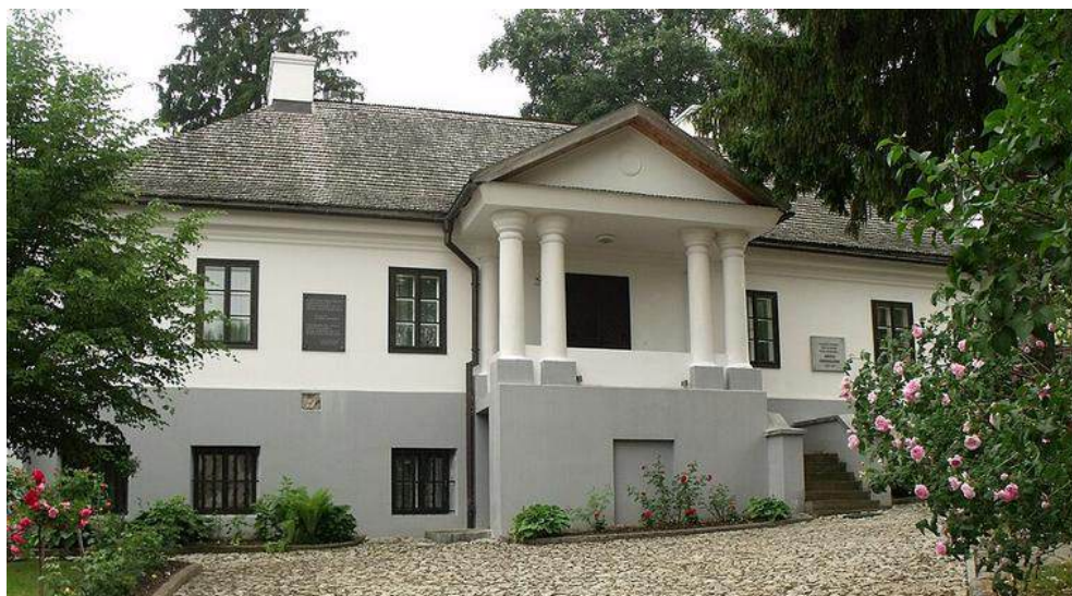
Рис. 5. Будинок-садиба польського поета Юліуша Словацького, м. Кременець [4]

Цікавою локацією для шкільних краєзнавчих екскурсій є будинок-садиба польського поета Юліуша Словацького (рис. 5) побудована в стилі класицизму наприкінці XVIII ст. [4].