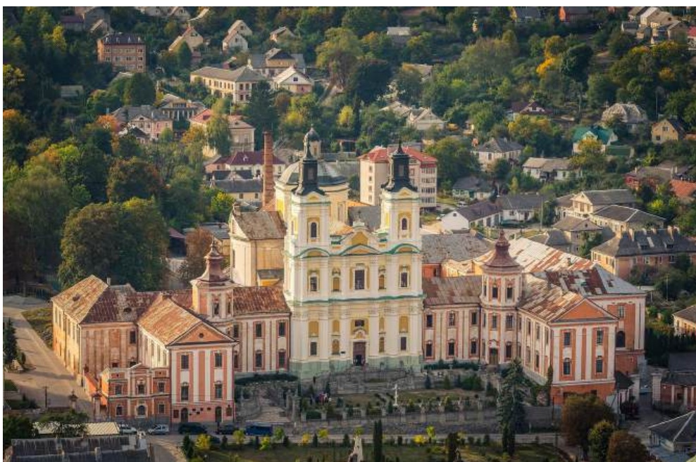
Рис. 1. Краєвиди м. Кременець Тернопільської області. На передньому плані – Собор Преображення Господнього ПЦУ [8]

Сьогодні, відповідно до «Стратегія розвитку Кременецької міської територіальної громади 2023–2028» поселення є центром однойменної територіальної громади Тернопільської області, в ньому проживає понад 20 тис. ос., його площа становить 18,14 км 2 і місто означається одним з найдавніших міст України [20]. Завдяки своїм мальовничим краєвидам і туристичним атракціям місто іменують «маленькою волинською Швейцарією» [8, 20] (рис. 1).