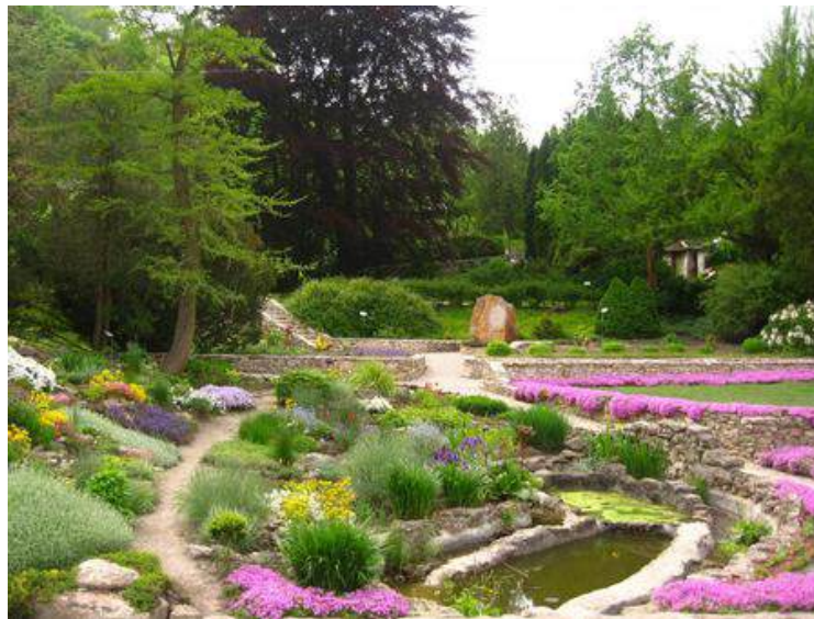
Рис. 2. Кременецький ботанічний сад [16]

Потік Ірва може слугувати основою для набуття практичних навичок під час вивчення тем з гідрології, екології, картографії і топографії у курсі «Географія» середньої школи. Його довжина біля 7,13 км, він бере початок у південній частині м. Кременець, є правим допливом р. Ікви (басейн Дніпра) [8].