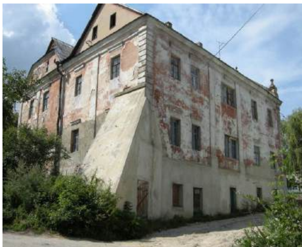
Рис 4. Будинки «Близнята» м. Кременець [2]

З історико-культурних об'єктів цікавим для проведення шкільних краєзнавчих екскурсій є архітектурна пам'ятка будинки «Близнята» (рис. 4). Розташована біля колишньої площі Ринок, а зараз Меморіалу Слави. Унікальність об'єкту в тому що два цегляні двоповерхові житлові будинки мають спільну внутрішню стіну [6].