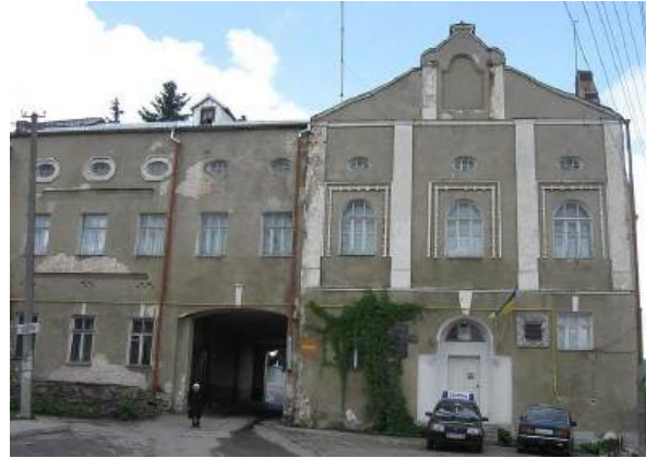
Рис. 6. Кременецький краєзнавчий музей

Кременецький краєзнавчий музей містить близько 65 тис. експонатів, що характеризують матеріальну, природну й духовну культуру та етнографічні особливості Південно-Західної Волині. Музей складається з 10 залів, де показано різні палеонтологічні, ентомологічні, археологічні збірки, колекції зброї, предмети побуту та інші вироби [11]. Музейний просторі зараз активно модернізується. На його базі проходять майстер-класи, які зацікавлюють здобувачів освіти, наприклад: «10.06.2020 р. відбувся майстер-клас із приготування автентичної локальної страви – кременецького вишневого борщу» [11].