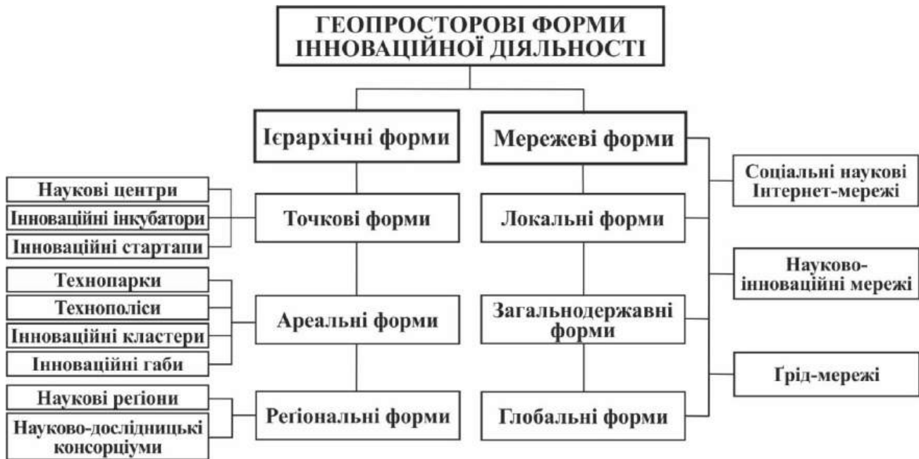
Рис. 3. Просторові форми наукової діяльності (М. Влах, Л. Котик, 2019)