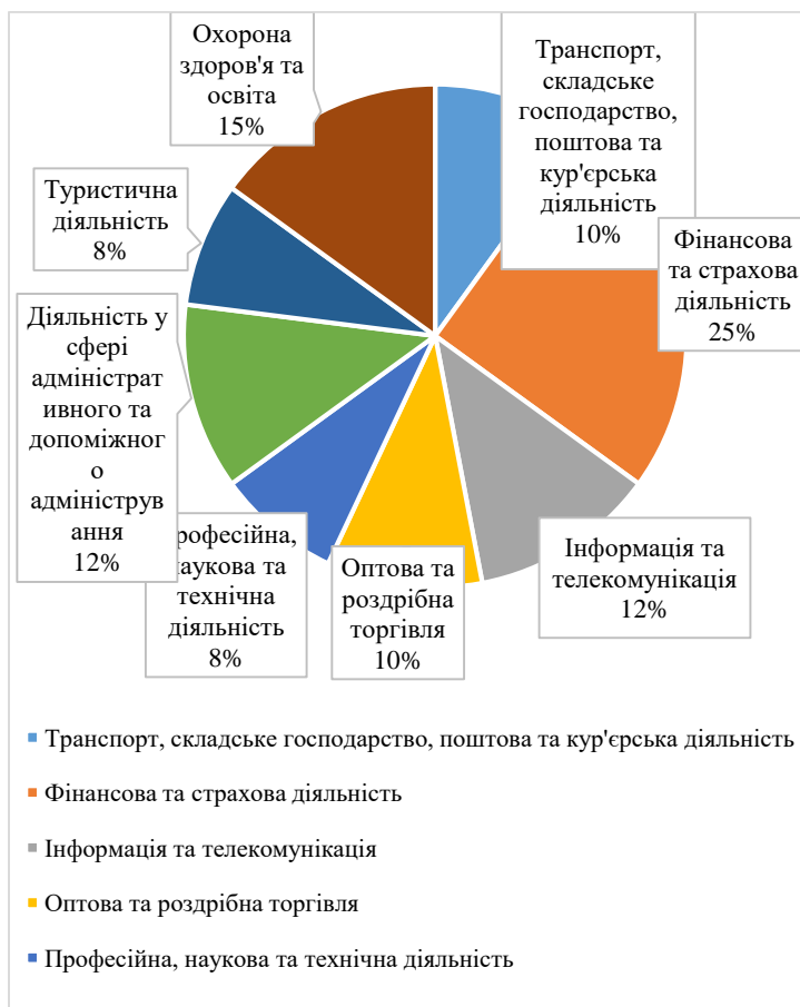
Рис. 2. Співвідношення послуг за видами економічної діяльності, 2020 2