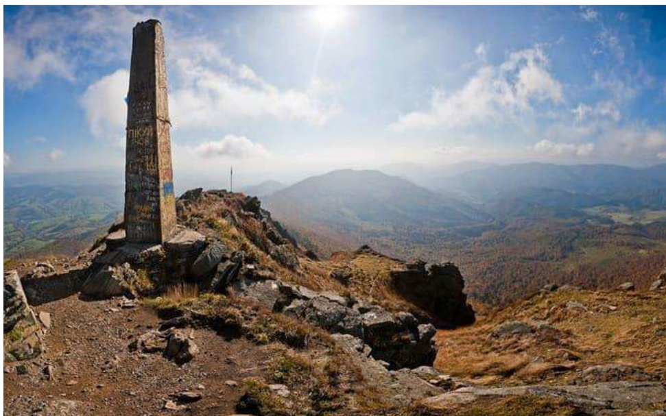
Рис. 2.4. Вершина гори Пікуй [28]

В зоні пішої доступності від вершини знаходиться Водоспад Воеводин. Це каскадний водоспад заввишки до 24 метрів, який впадає у річку Шипіт. Його відвідування є ускладненим через особливості маршруту.