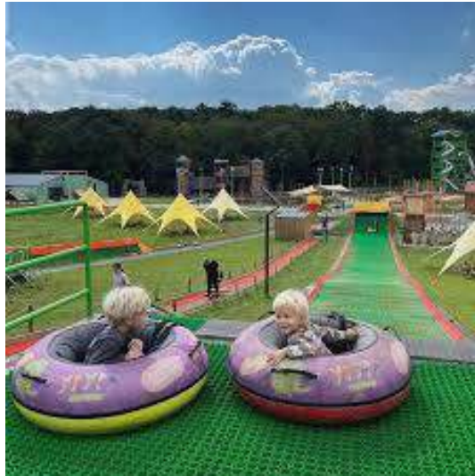
Рис. 2.8. Атмосфера парку розваг «Уруру» [23]

Територія парку становить близько 10 га. Атракціон-сітки / батути: Найбільша зона сіток-батутів — \approx 3000 \text{ м}^2 , водяне містечко: площа — \approx 700 \text{ м}^2 , анімовані динозаври: понад 20 інсталяцій (два десятки анімованих динозаврів). До послуг відвідувачів - лазанки, гойдалки, гірки: з різним рівнем складності — для молодших і старших, тубінг-траси, вежа з гірками, висотні мережі, заклади харчування: на території є піцерія, кіоски із перекусами, магазин з тематичними сувенірами.