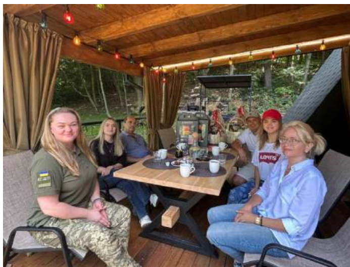
Рис. 3.1. Ветерани з родинами у відпочинковому комплексі Time ForRest [16]

Програма відновлення «Відпочинок родин Героїв» включає роботу з психологом, арт-терапію, екскурсії, прогулянки затишною лісовою місцевістю, вело-прогулянки, смачна їжа, спа-процедури тощо [16].