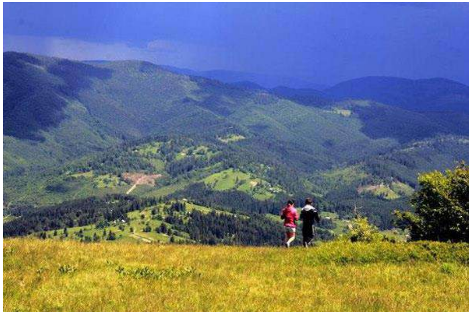
Рис. 2.5. Панорама Захар Беркут [25]

Відвідування гірськолижного комплексу «Захар Беркут» рекреантами передбачає використання підйомника для сходження на вершину Високий Верх (1242 м над рівнем моря). З вершини відкриваються панорамні краєвиди на Верховинський Вододільний хребет та Сколівські Бескиди, що є ідеальним місцем для фотографій та споглядання природи.