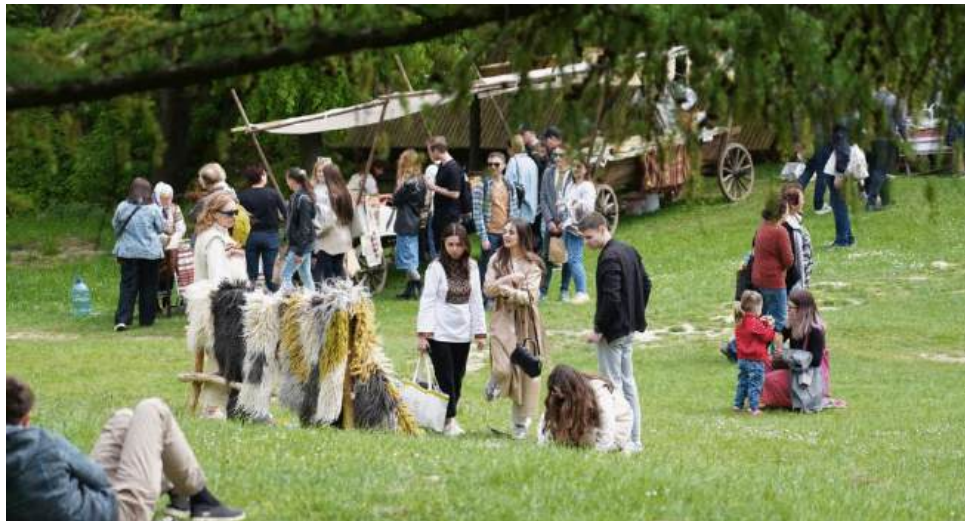
Рис. 4.1 Ярмарок у Музеї народної архітектури (м. Львів) [20]

У липні у Музеї народної архітектури та побуту відбувся ярмарок, який привернув увагу поціновувачів традицій, ремесел та гастрономії, додатково підвищуючи туристичну привабливість регіону.