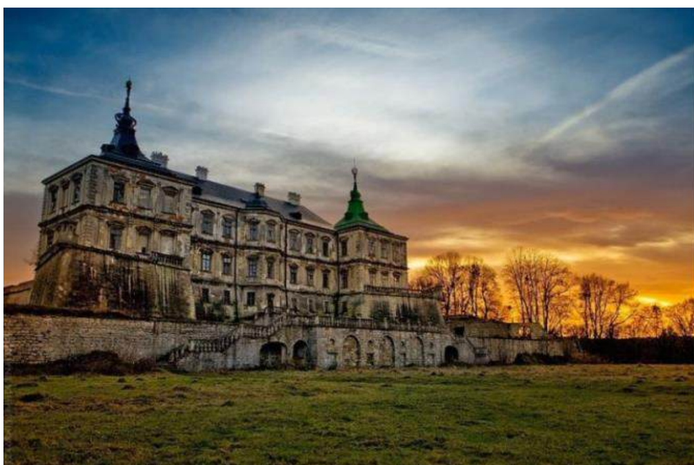
Рис. 2.3 Підгорецький замок [5]

Замок вирізняється значним рекреаційним та естетичним потенціалом. На території замку знаходиться «італійський» парк, що пропонує відвідувачам можливість для прогулянок та естетичної насолоди. З верхніх точок замкового комплексу відкриваються панорамні краєвиди, що є значною перевагою для туристів. Інтер'єри та екстер'єри замку, включаючи декоративне оздоблення величних залів, мають високу привабливість для організації професійних та оригінальних фотосесій. Об'єкт оповитий містичним елементом — легендою про «Білу пані», що підвищує його туристичну унікальність та привабливість.