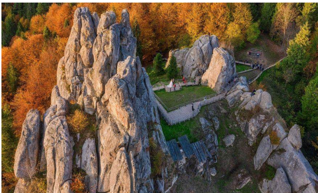
Рис 2.2 Фортеця Тустань (Львівська обл) [27]

споруд, яка є яскравим прикладом середньовічної військової архітектури. Об'єкт має значну історичну цінність, оскільки відтворює атмосферу Середньовіччя. На скельних утвореннях збереглися петрогліфи — таємничі знаки, походження та розшифрування яких є предметом глибокого вивчення провідними істориками та дослідниками. Комплекс включає скелі Камінь та унікальні природні дива, що гармонійно доповнюють історичні залишки. На території заповідника розташована гідроспоруда в урочищі "Стави", що дозволяє оцінити масштабність інженерних рішень періоду функціонування комплексу. Заповідник є майданчиком для проведення щорічного фестивалю середньовічної культури «Ту-стань!» (з 2006 року), що сприяє популяризації історичної спадщини [27].