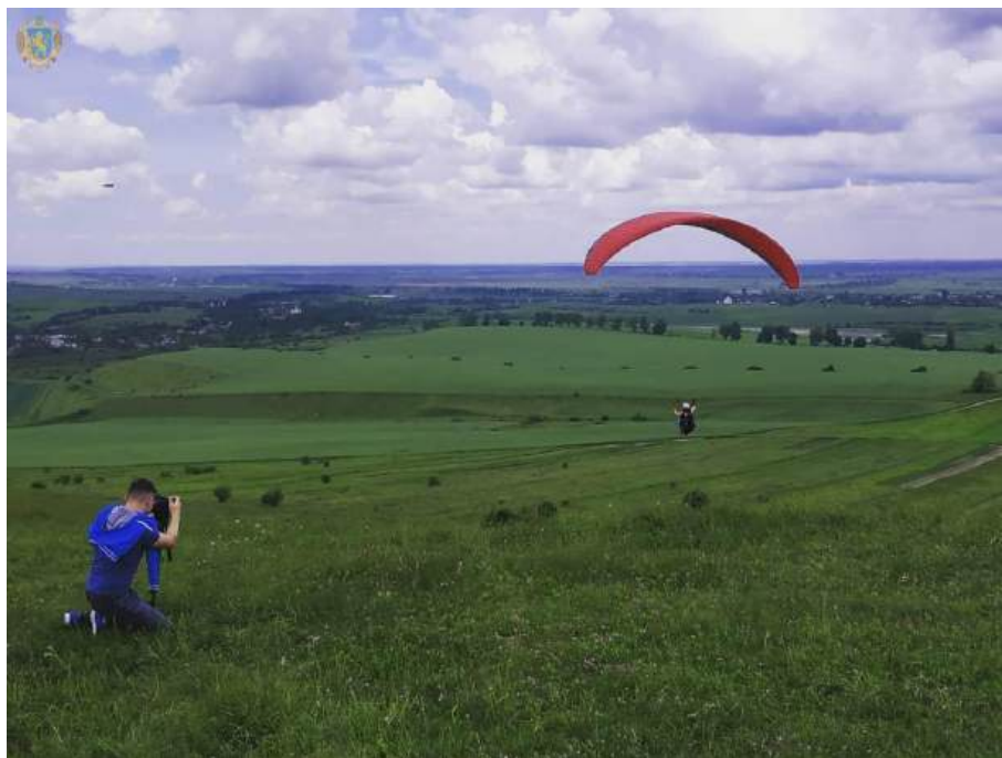
Рис. 4.3. НПП «Подільські Товтри» [10]

Маршрут у межах Гологір передбачає поєднання природного відпочинку, огляду об'єктів історико-культурної спадщини, можливості придбати вироби з гаварецької чорної кераміки та ознайомитися з традиційною галицькою кухнею [10].