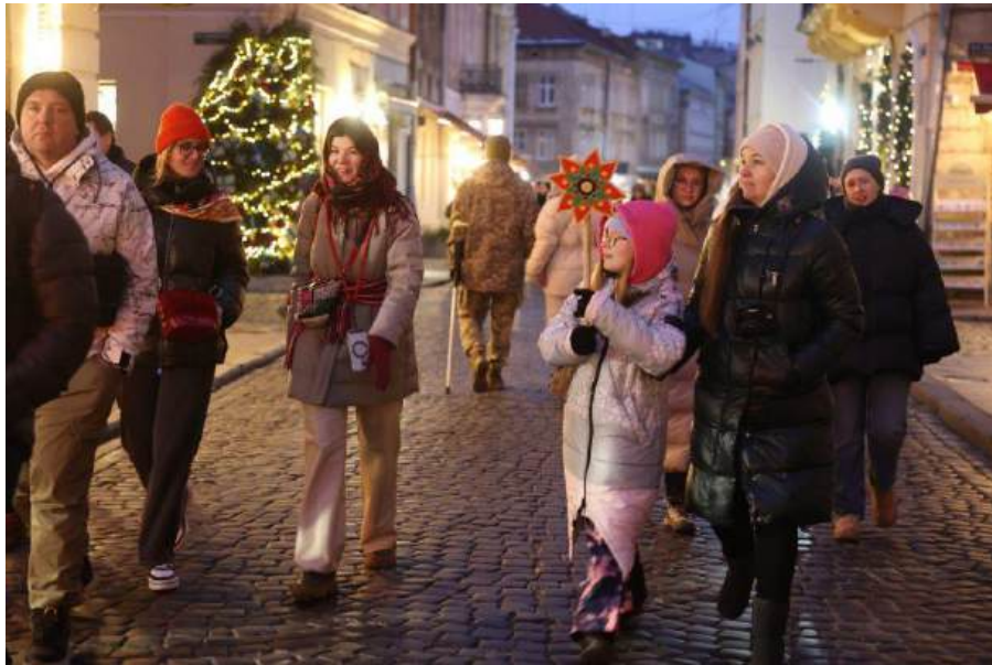
Рис. 4.2. Велика різдвяна екскурсія/Львівська міська рада [31]

Серед нових та запланованих маршрутів виділяється Camino Ruteno: Чортків — Львів, піший та веломаршрут, створений за моделлю відомого паломницького шляху Camino de Santiago. Крім того, впроваджуються меморіальні маршрути, присвячені Ірині Фаріон («Контур особистости на мапі Львова») та проєкту «Личаків. Там, де мовчать і говорять».