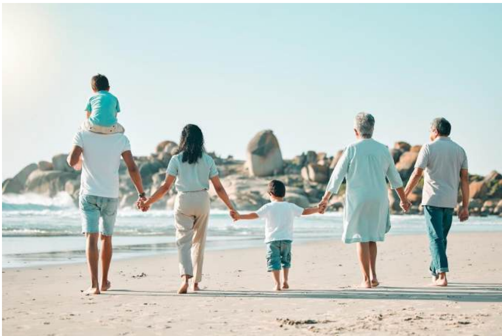
Рис. 2.1. Сімейна подорож кількох поколінь [38]

Сімейна подорож — це поїздка, під час якої члени сім'ї разом подорожують з метою відпочинку, відкриття нового або зміцнення сімейних зв'язків. Такі подорожі дають можливість відволіктися від повсякденної метушні, насолодитися новим оточенням, краще зрозуміти один одного та зблизитися [38].