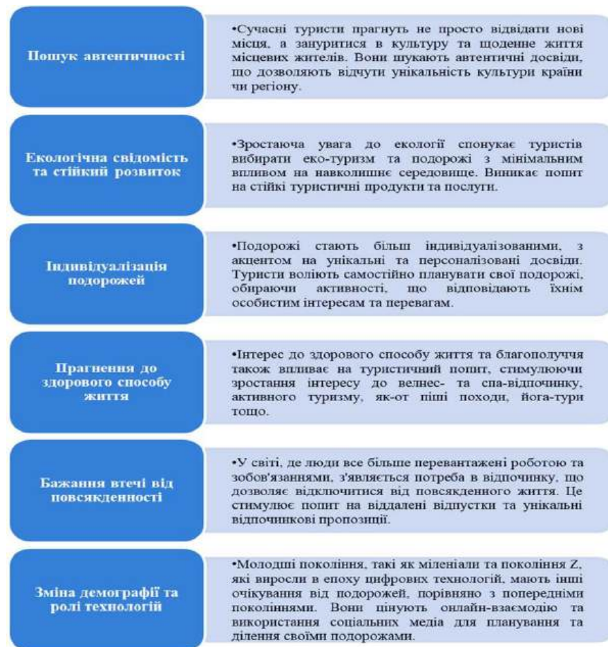
Рис 1.1. Культурні тенденції, що впливають на туристичний попит [2]

Для туристичної індустрії це вимагає переорієнтації пропозиції з масового туризму на диференційовані, нішеві продукти, які забезпечують високий рівень культурної достовірності та оригінальності досвіду.