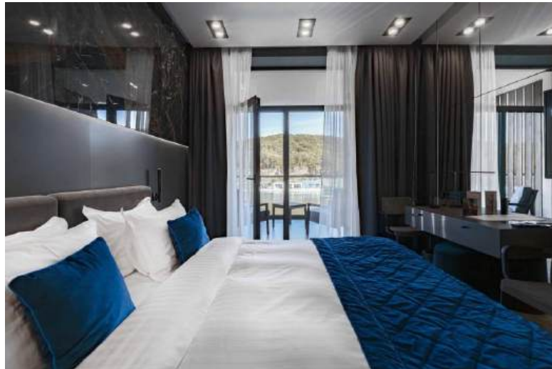
Рис. 2.7. Приклад сімейного номеру у Emily Resort [1]

Відпочинковий комплекс має спеціально облаштовані майданчики для дітей різного віку. Діти можуть грати на гірках, качелях, пісочницях та інших безпечних ігрових елементах. Для маленьких гостей є закриті ігрові кімнати, де діти можуть грати під наглядом аніматорів або батьків. Це дає можливість батькам розслабитись і зайнятись своїми справами, поки діти займаються творчістю чи розвагами.