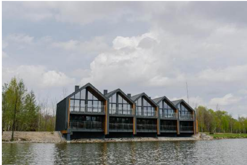
Рис. 2.9. Релакс-комплекс «Шепільська» (с. Довголука) [21]

природної локації, комфортного розміщення та розвиненої розважальної інфраструктури.