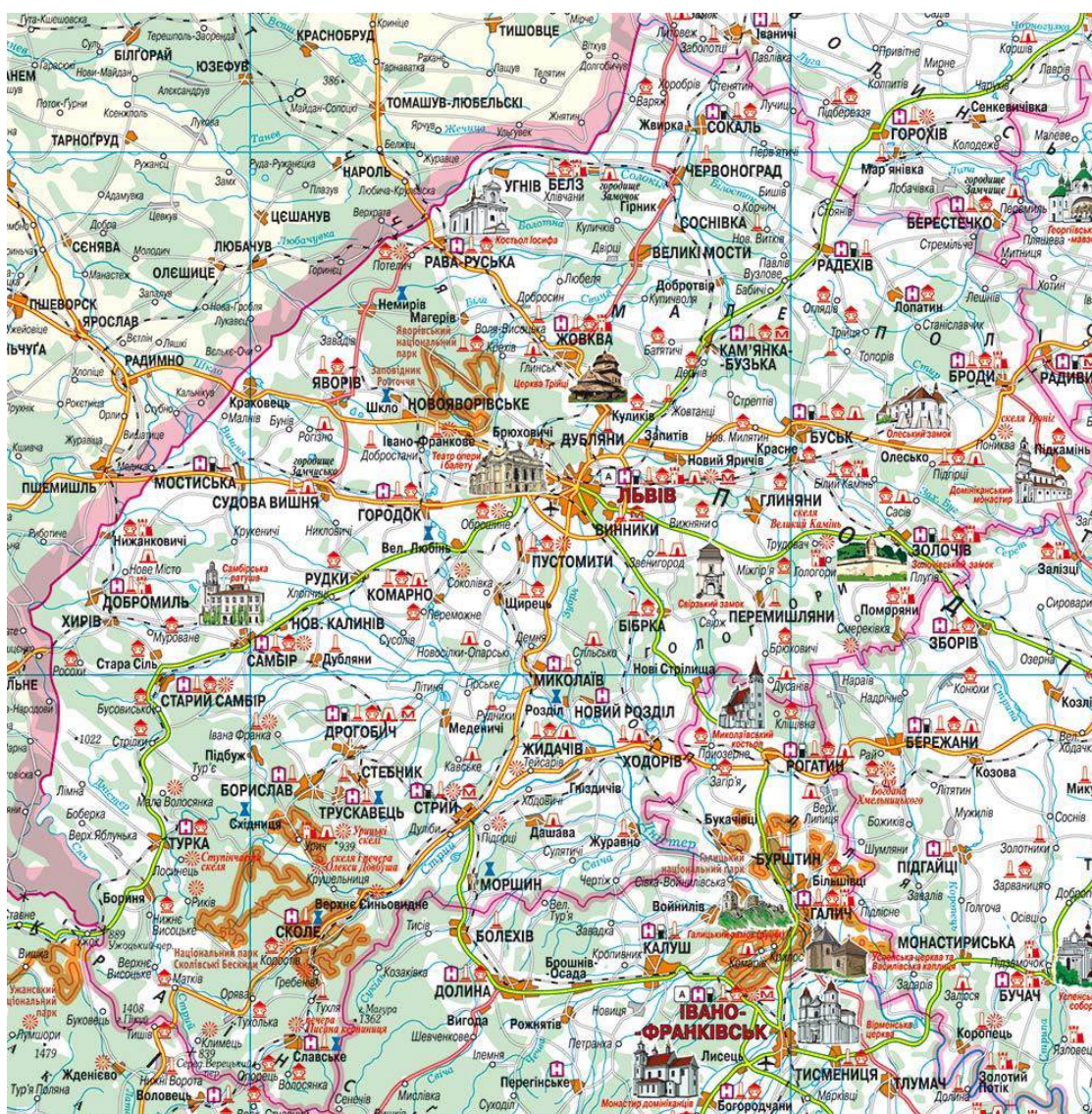
Рис 2.1. Туристична мапа Львівської області [9]

Львівська область пропонує безліч чудових місць для сімейного відпочинку. У даному розділі дослідження проаналізовано туристичні атракції, які найкраще підійдуть для відвідування з родиною, поєднуючи активності, природу та історію.