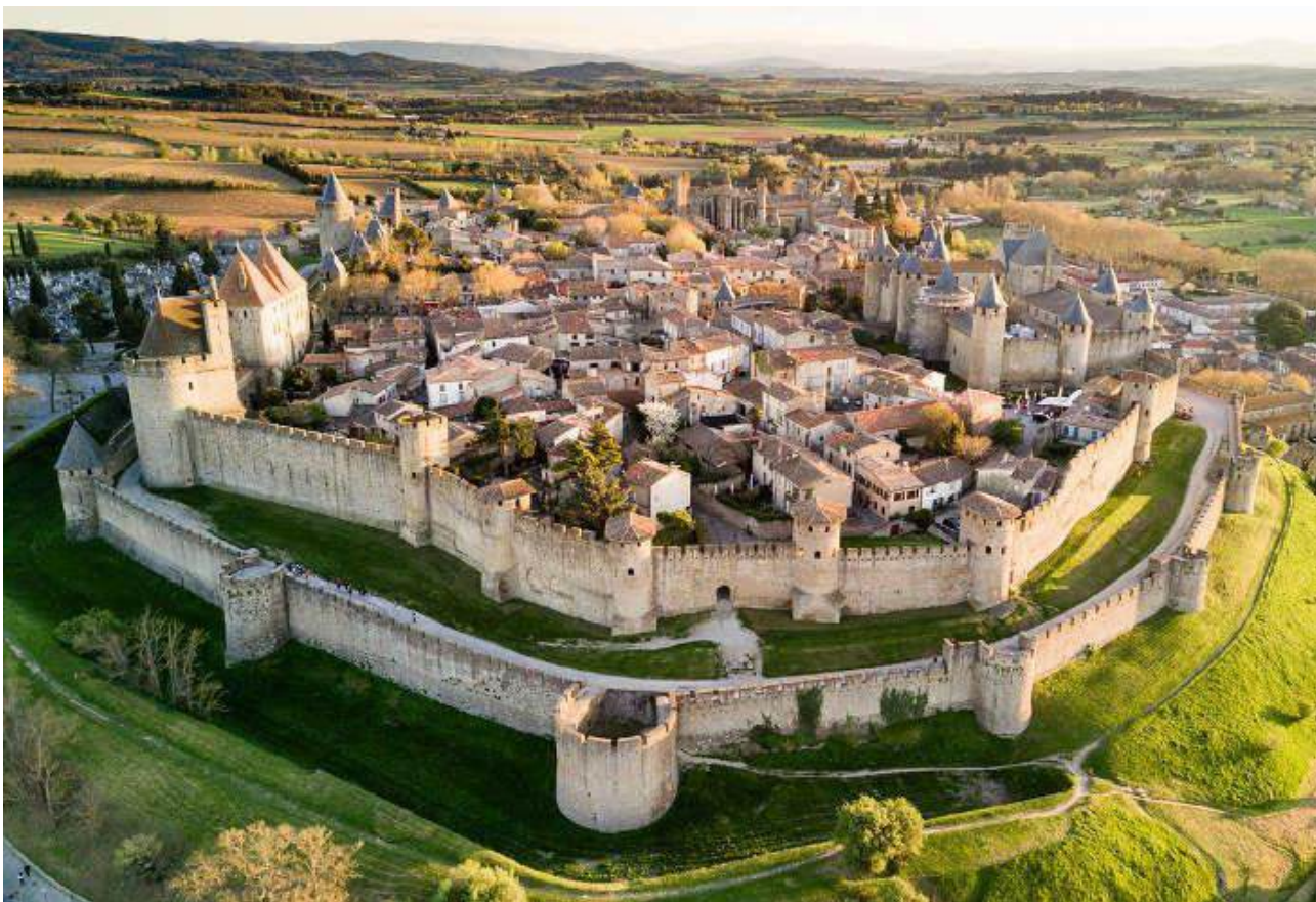
Рис. Б.3. Замок Каркассон