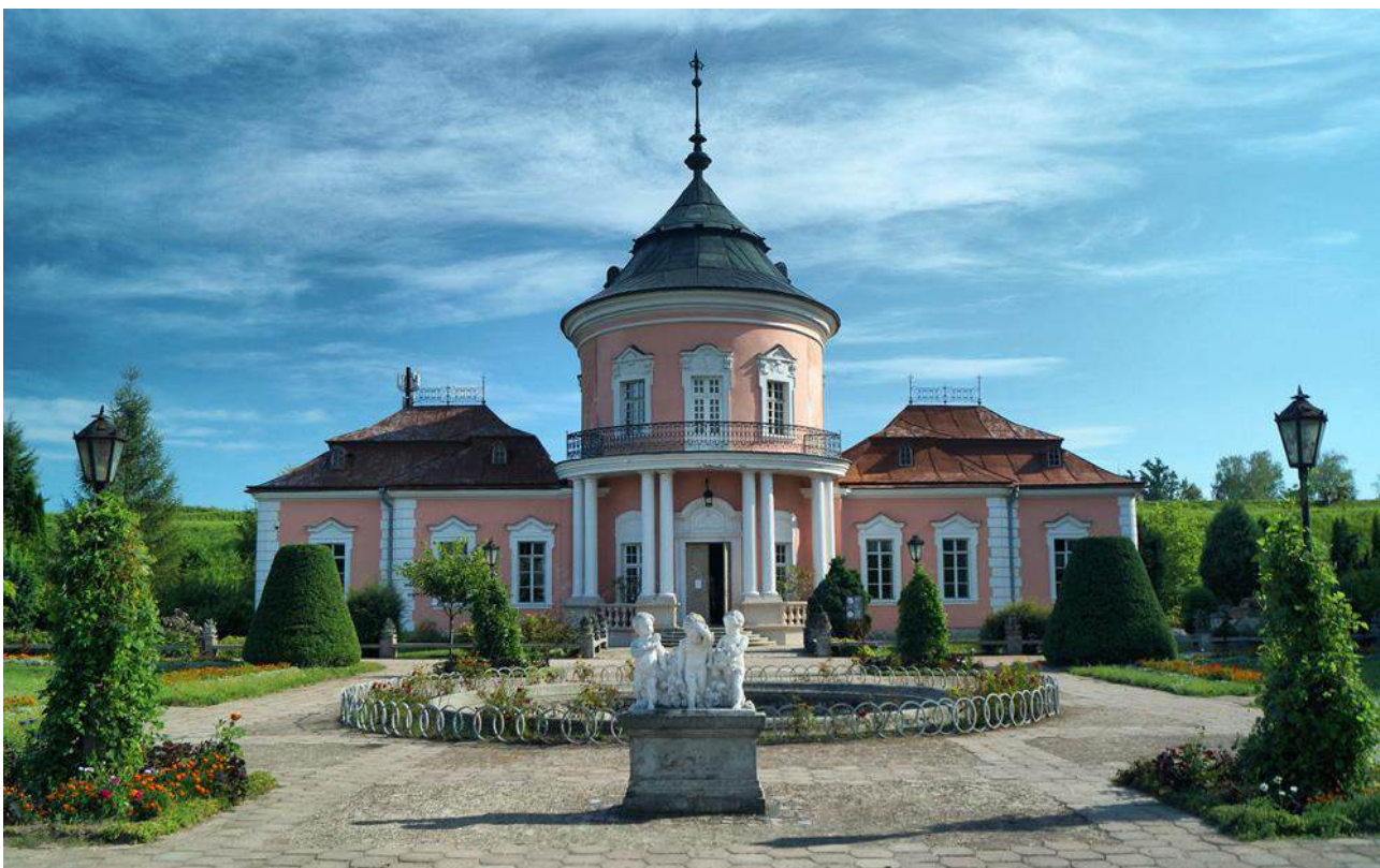
Рис. А.3. Золочівський замок