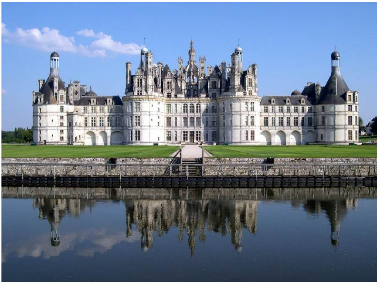
Рис. Б.1. Замок Шамбор