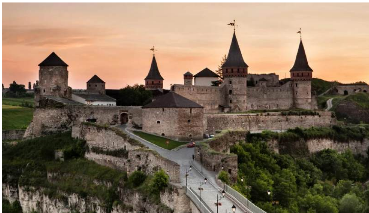
Рис. А.5. Кам'янець-Подільська фортеця