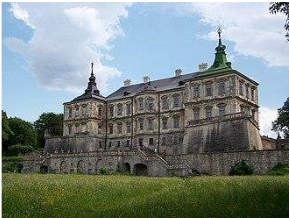
Рис. А.2. Підгорецький замок