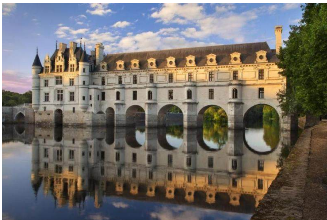
Рис. Б.2. Замок Шенонсо