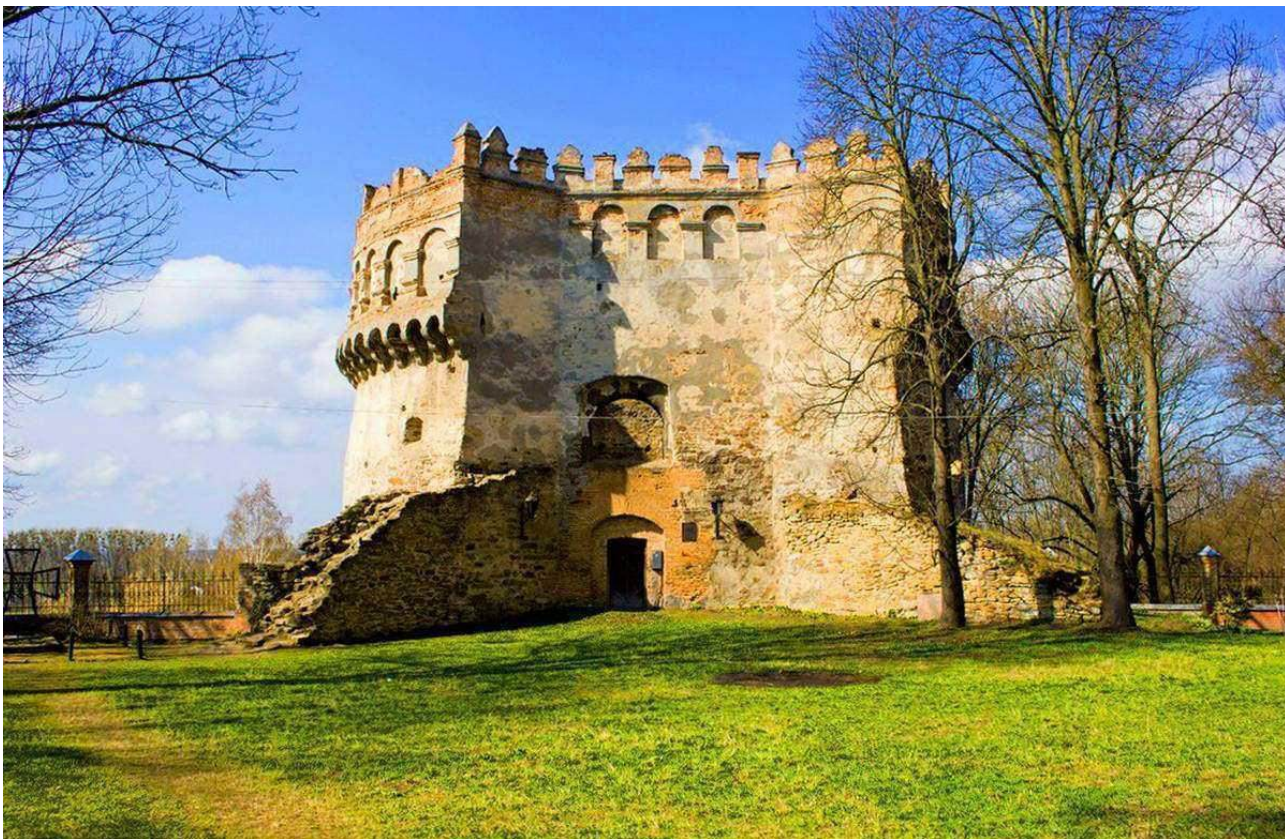
Рис. А.9. Острозький замок