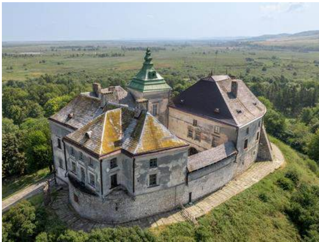
Рис. А.1. Олеський замок