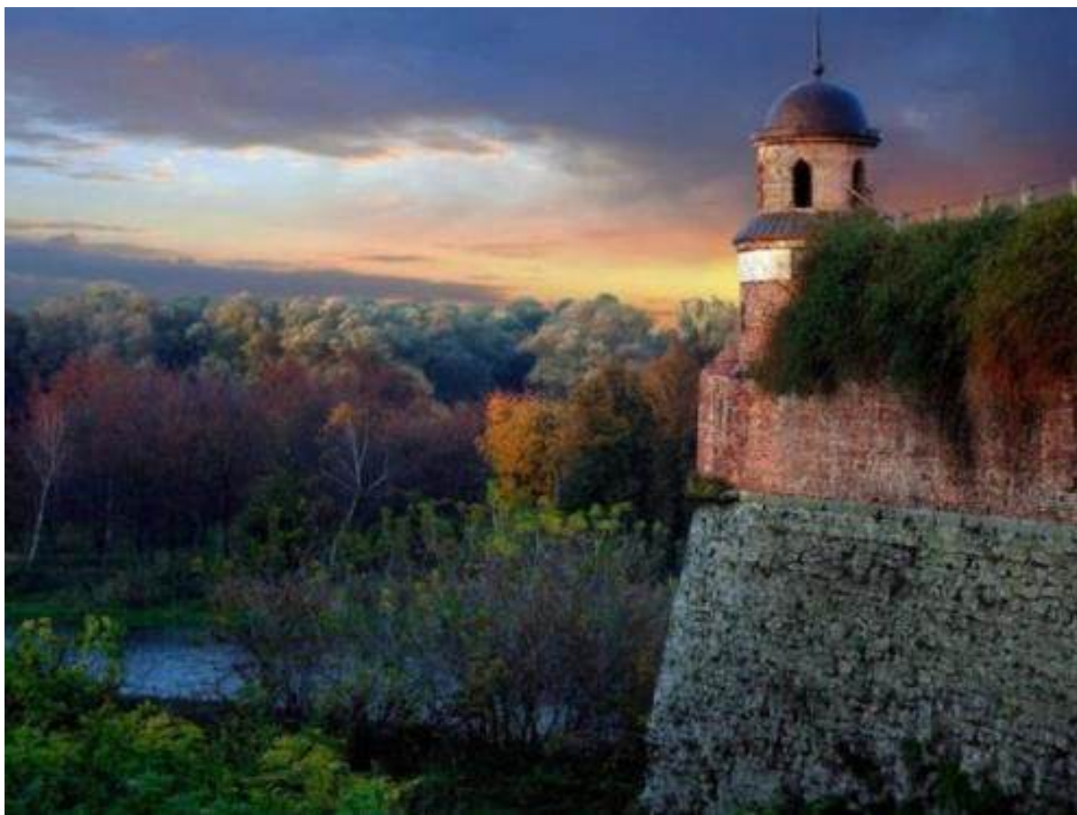
Рис. А.10. Дубенський замок