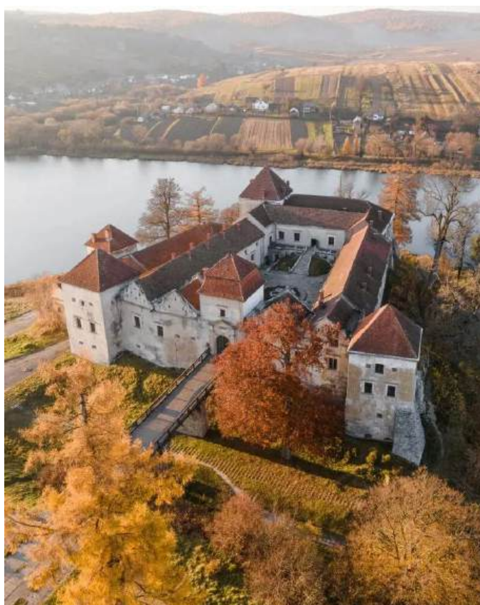
Рис. А.8. Свірзький замок