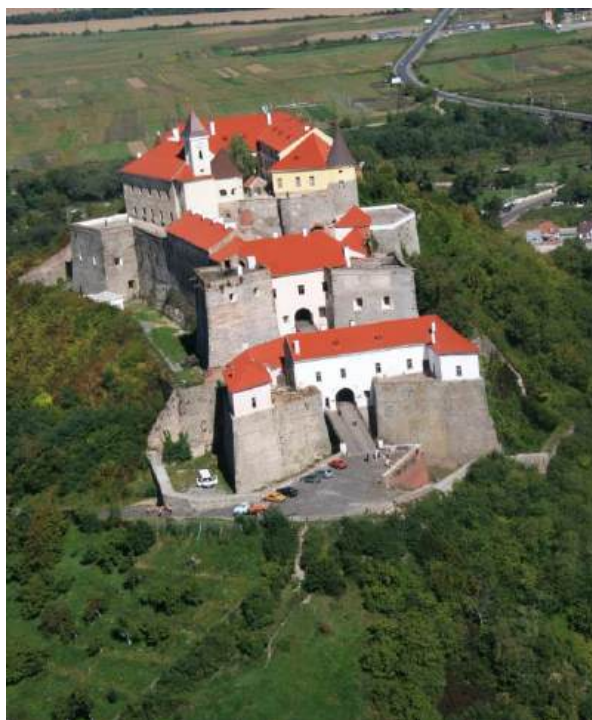
Рис. А.7. Мукачівський замок «Паланок»