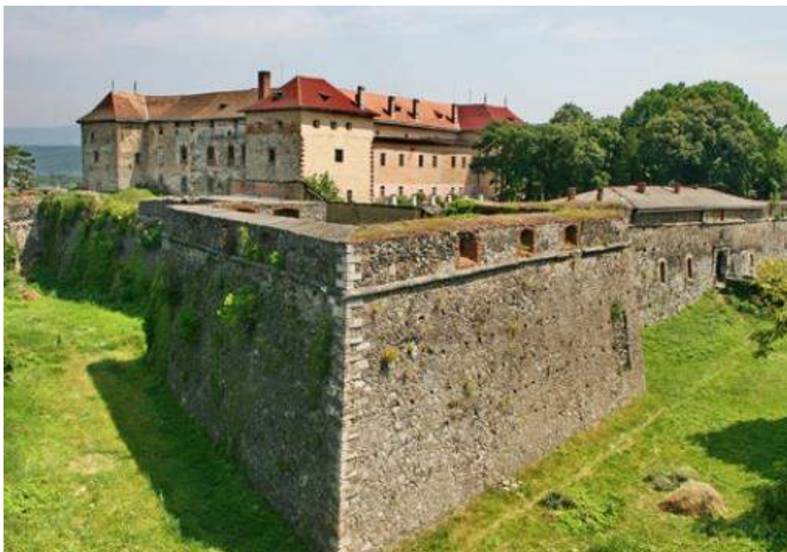
Рис. А.6. Ужгородський замок