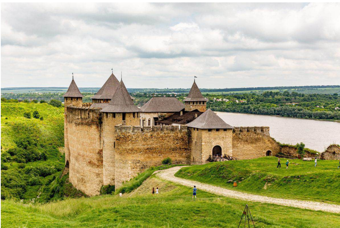
Рис. А.4. Хотинська фортеця