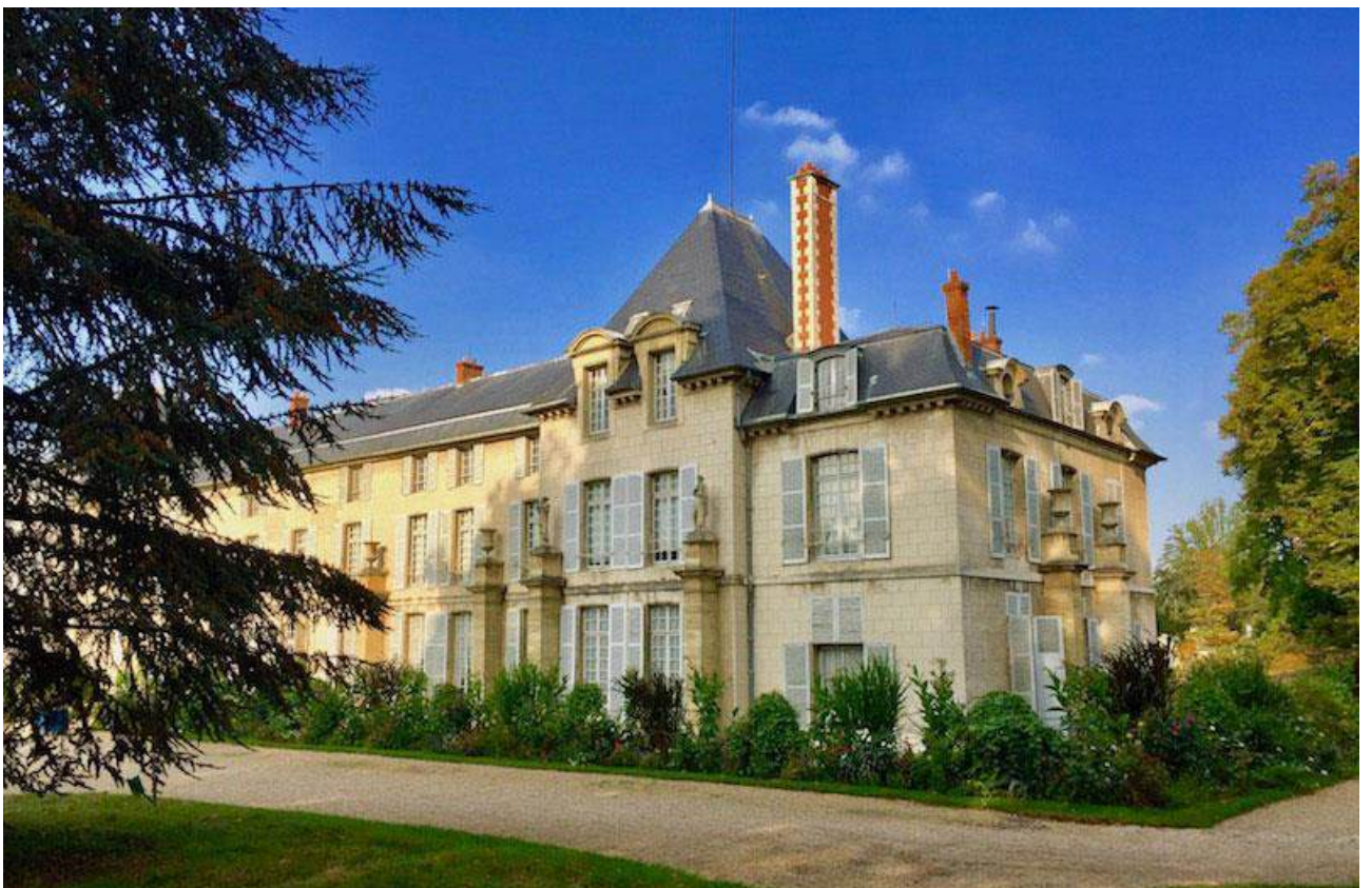
Рис. Б.6. Замок Мальмезон