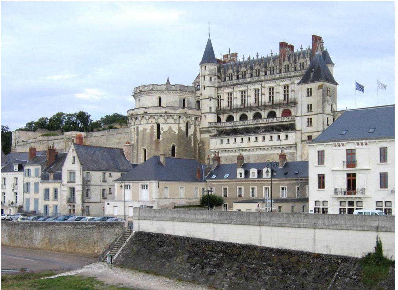
Рис. Б.5. Замок Амбуаз