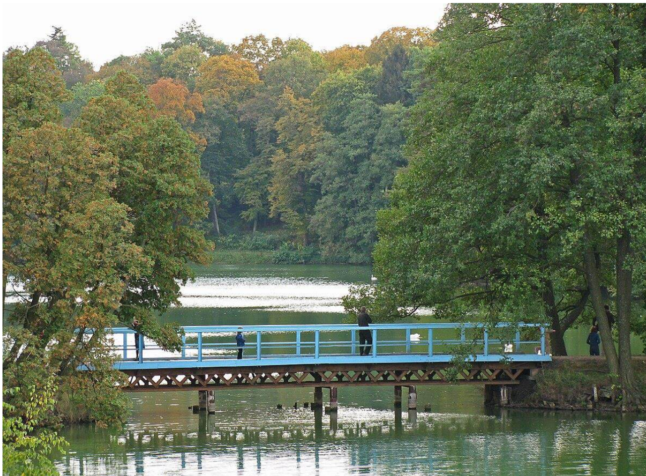
Рис.5. Тростянецький ландшафтний парк

https://anga.ua/sights/trostyaneckiy_dendropark.html