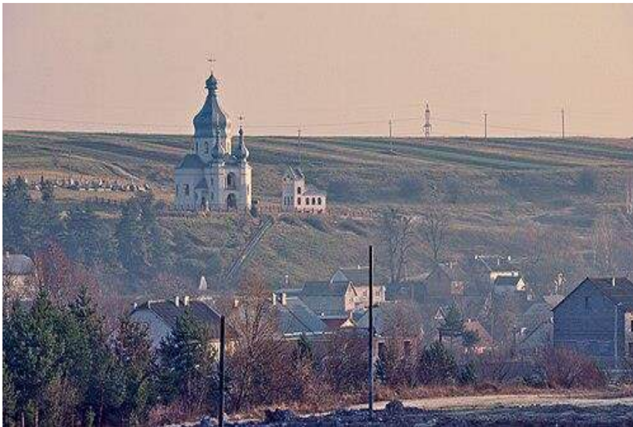
Рис.7. Паномара села з церквою св.Трійці

https://upload.wikimedia.org/wikipedia/commons/4/4f/Trostianets_Mykolaiv_Raion_Lviv_Oblast.jpg