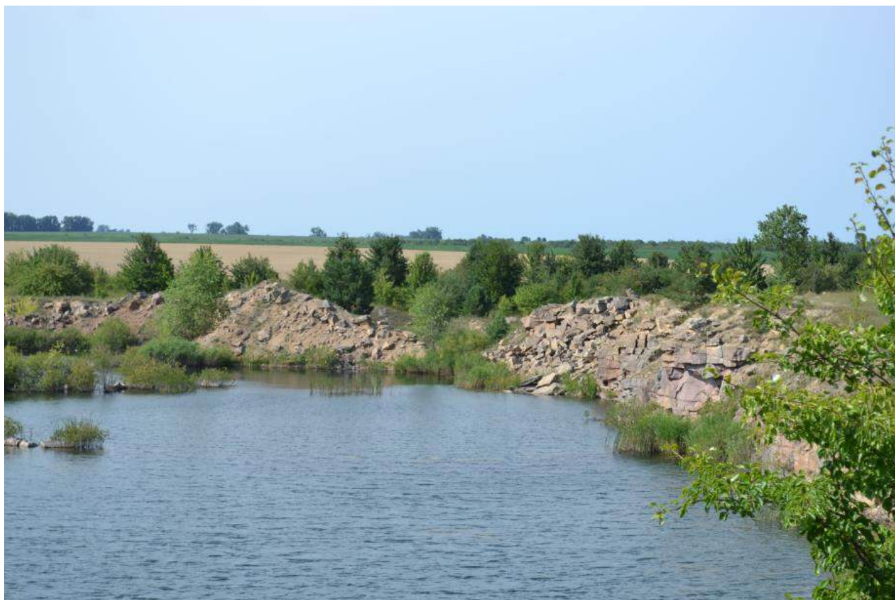
Рис.6. Кар’єри Тростянця https://funtime.com.ua/u/i/grid/2025/04/blakytни-ozera-sobkivky-3-6806406985915.jpg

Цей пункт дозволяє відчувати особливості природного ландшафту і показати промислову історію регіону. Кар’єри використовуються як навчальні майданчики для пояснення геологічної будови, екології та процесів відновлення природного середовища після господарської діяльності. [56, 28]