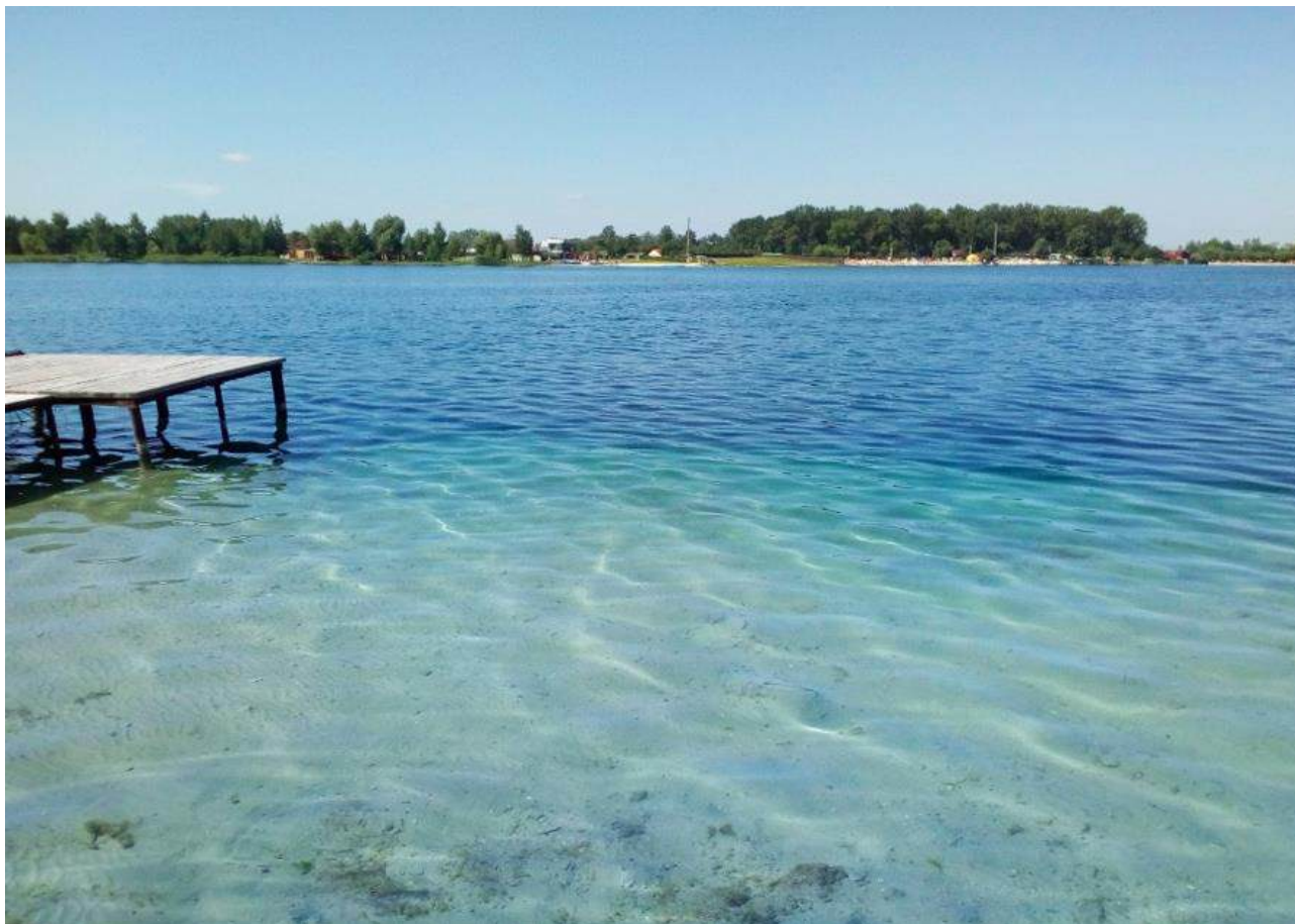
Рис.4. Озеро Задорожнє

Озеро Задорожнє — це мальовнича штучна водойма кар’єрного походження з дуже чистою та прозорою водою, яка приваблює відпочивальників своєю спокоем і природною красою. Тут є і облаштовані платні пляжі з альтанками, шезлонгами, кафе та зручностями, і безкоштовні ділянки, де можна розкласти намет або відпочити просто біля води. Озеро популярне серед рибалок, адже у водоймі водяться окунь, щука й карась, а також серед любителів активного відпочинку — глибока вода підходить для пірнання та дайвінгу. Поруч працюють бази відпочинку з котеджами та прокатом човнів чи катамаранів, що робить місце зручним як для сімей, так і для компаній друзів. У літній сезон сюди приїжджають сотні туристів щодня, тому озеро давно стало однією з найпопулярніших водойм для короткого відпочинку неподалік Львова.