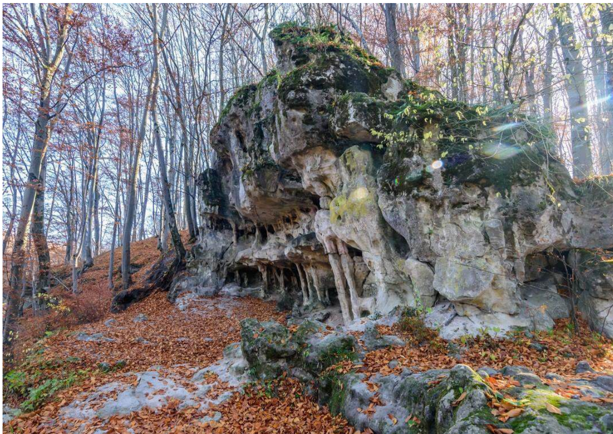
Рис.3. Грот (печера) Прийма https://karpatium.com.ua/hirski-masyvy/hrot-pryima [25]

В оточенні цих історичних споруд розташовані й природні рекреаційні ресурси, серед яких особливо вирізняється Озеро Задорожнє — популярна місцина для відпочинку, що доповнює культурну спадщину громади можливістю поєднати огляд пам'яток із природними мальовничими краєвидами.»