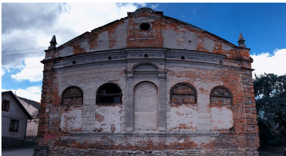
Рис. 4.2. Синагога – єврейська молитовна споруда.

Архітектура Старосамбірщини має свою давню історію. В селах і містах збереглися цінні пам'ятки будівництва, які свідчать про високу культуру наших предків протягом століть. На підвищенні, в центрі міста Старого Самбора, знаходиться синагога – єврейська молитовна споруда. Єврейська святиня невеличка за розміром, яка на даний час своїм зовнішнім виглядом нагадує розвалини [35].