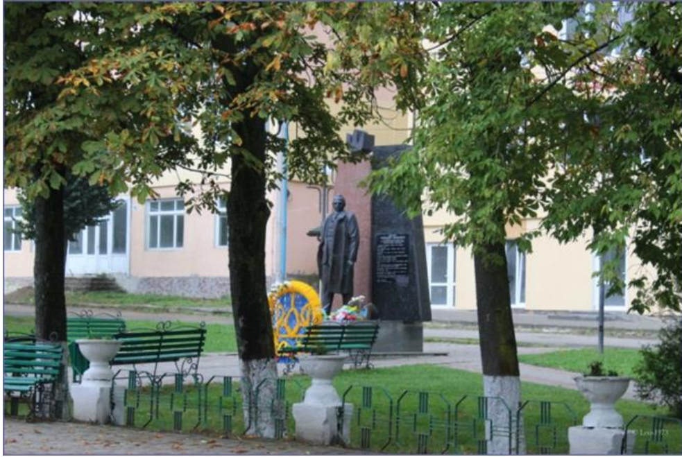
Рис. 4.8. Пам'ятник Степанові Бандері у Старому Самборі, 2008 р., (автори І. Самотос та В. Камінщик. http://p.starosambir.net.ua/ )

Отже, на території Старосамбірщини до сьогоднішнього часу збереглися ціла низка цікавих історико-культурних об'єктів. Ці об'єкти, без сумніву володіють значними можливостями для організації різних видів туризму. Однак, для цього необхідно всіляко популяризувати збережену історико-культурну спадщину Старосамбірської громади.