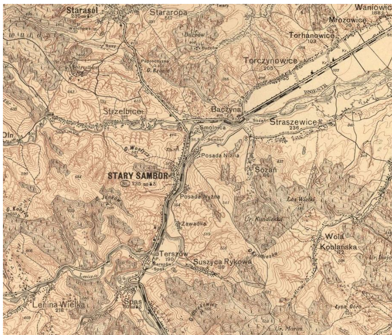
Рис. 3.2. Околиці Старого Самбора на топографічній карті Військового географічного інституту у 1927 р. [13].

Автомобільний транспорт є найпоширенішим способом пересування в громаді, адже він дає туристам свободу та гнучкість у плануванні маршруту. Через громаду проходить залізнична лінія Львів–Самбір–Сянки, яка сполучає Старий Самбір з іншими містами України та Західної Європи.