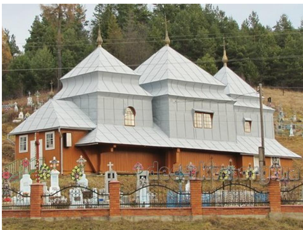
Рис. 4.5. Церква у селі Соснівка. http://decerkva.org.ua/

До найдавніших храмів відноситься і церква у Соснівці. Найдавніша згадка про церкву збереглися в вкладному написі на “Антологіоні” 1643 року