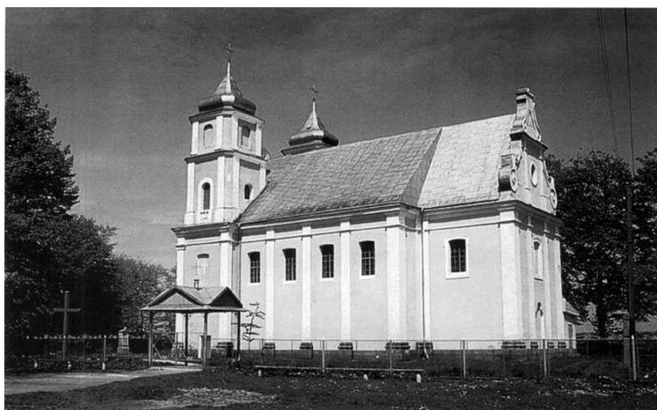
Рис.4.2. Церква Воздвиження Чесного Хреста. 1794. с. Страшевичі

На території Старосамбірської громади збереглися низка цікавих дерев'яних храмів. Вони відзначаються різним часом створення, різним сучасним станом та відмінними можливостями для використання.