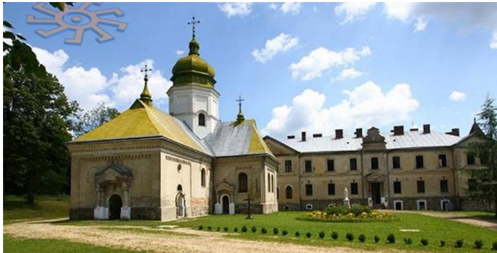
Рис. 4.7. Лаврівський монастир

історична згадка про нього міститься в грамоті польського короля Ягайла, виданій 1407 р. в Сандомирі (Польща). За легендою, у Лаврівському монастирі знаходиться місце поховання галицько-волинського князя Лева Даниловича. З давньоруських часів, окрім вівтарної частини храму, збереглася дзвіниця.