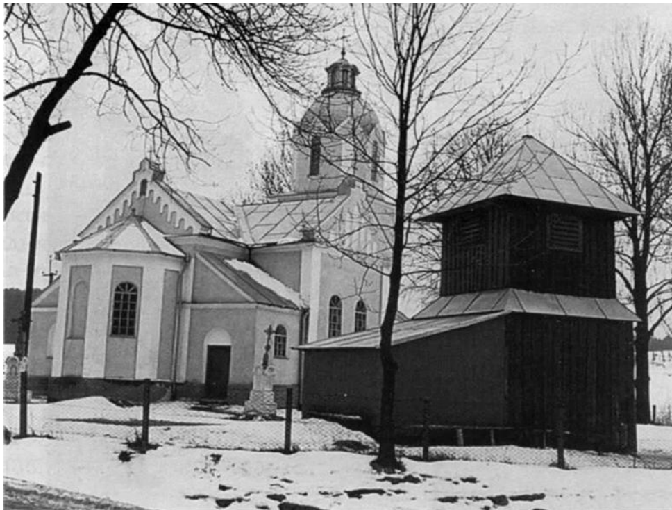
Рис.4.3.Церква Св. арх. Михаїла XIXст. с. Волошиново. https://www.pslava.info/

Костел св. Архангела Михаїла у селищі Стара Сіль, що неподалік від Старого Самбора, був зведений у 1660 р. у стилі бароко і вважається найбільш довершеним серед архітектурних споруд селища. Стара Сіль, окрім костелу, може похвалитися ще й двома старовинними дерев'яними храмами – Параскеви П'ятниці та Воскресіння Господнього. Костел св. Архангела Михаїла – споруджений з цегли, прямокутний у плані, з напівкруглим пресвітерієм, який підсилюють контрфорси. Біля його північного фасаду знаходиться старовинна, квадратна у плані каплиця св. Анни, фасади якої оформлені фризом та арковими нішами.