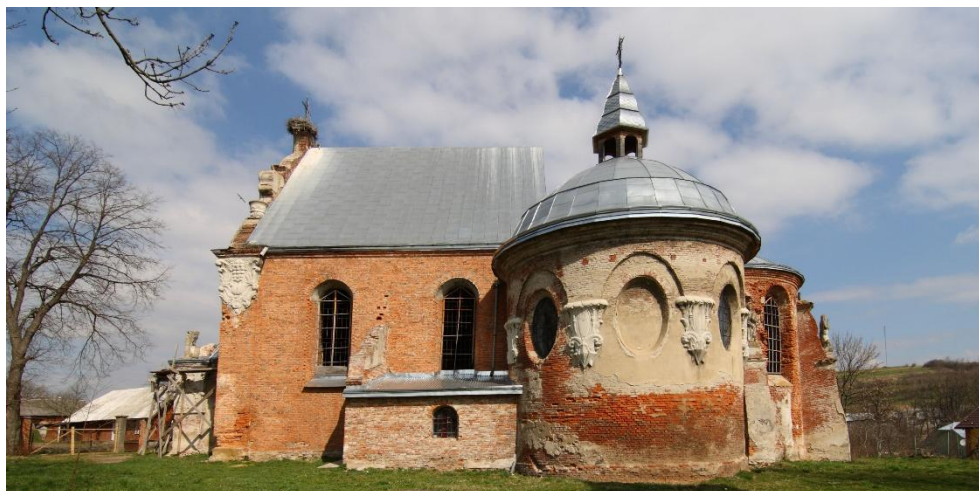
Рис. 4.4. Костел св. Архангела Михаїла у селищі Стара Сіль. https://uk.wikipedia.org/wiki/

описом 172 р. знаходилося сім вітварів. Упродовж усієї своєї історії будівля костелу зазнавала численних реконструкцій, про що свідчать нашарування певних елементів, останні з яких є результатом проведення ремонтних робіт у 20-тих роках минулого століття [35].