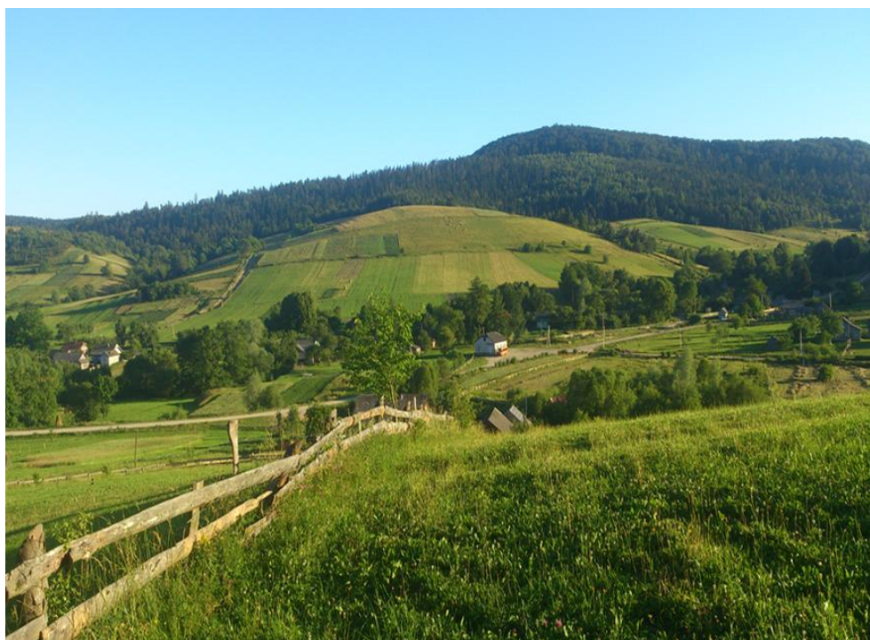
Рис. 4.1. Національний природний парк “Королівські Бескиди” https://uk.wikipedia.org/

У межах західної частини Старосамбірщини, у північній частині масиву Верхньодністровські Бескиди, розташований НПП “Королівські Бескиди”. Парк охоплює лівобережну частину басейну річки Дністер від міста Старий Самбір до села Стрільки, а також басейни річок Яблулька і Літинка. Створений НПП згідно з Указом Президента України № 526/2020 від 30.11.2020 року [26]. Створений з метою збереження, відтворення, ефективного використання природних комплексів Українських Карпат, які мають особливу природоохоронну, оздоровчу, історико-культурну, наукову, освітню та естетичну цінність. Особливу цінність мають лісові масиви, серед яких є ділянки з насадженнями понад 100 років. Заповідний об’єкт сприятиме збереженню, відтворенню, ефективному використанню природних ресурсів [26].