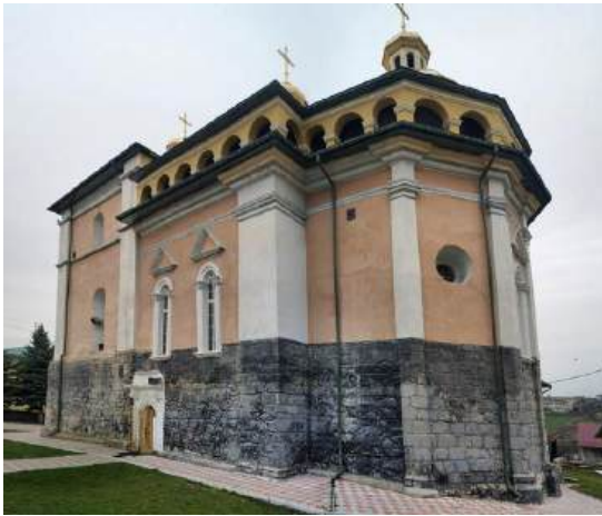
Рис. 6. Церква Успіння Пресвятої Богородиці [10]