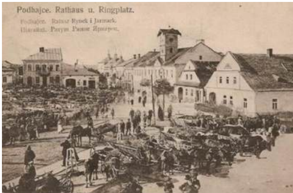
На початку ХХ ст.

У 20-30 рр. ХХ ст. поселення активно розвивається (рис. 5): споруджено гімназію, діє кінотеатр й футбольні клуби, побудовано великий Український Народний Повітовий Дім, людиність зростає до 10000 осіб [17]. Під час ІІ світової війни Підгайці зазнають катастрофічних потрясінь: знищена єврейська спільнота міста (у місті було гетто на сім тисяч осіб), знищено 70 % житлових будівель поселення [3]. У советський період поселення розвивається як периферійне аграрне сільське поселення, давню історичну спадщину «забувають», Підгайці входять до складу Бережанського району. [3]. Статус міста відновлюють лише за часів відновлення незалежності України (1991) у 2004 р.