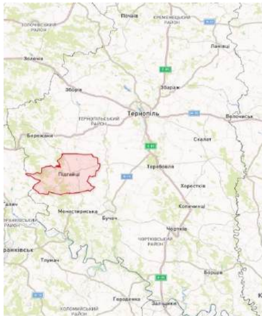
Рис. 1. Географічне розташування міста Підгайці Тернопільської області [12]

Підгайці – найменше за людністю міське поселення Тернопільської області; розміщене на заході області (рис. 1); характеризується периферійним розташуванням, що сповільнює соціально-економічний розвиток поселення, зокрема, і територіальної громади, загалом. Місто розташовано по прямій на відстані 64 км від обласного центру – м. Тернопіль; 68 км і 116 км від сусідніх обласних центрів м. Івано-Франківська і м. Львова [13]. Найближчі залізничні станції розміщені від м. Підгайці на відстані 20 км (станція Потутори) і 26 км (станція Бережани) [13].