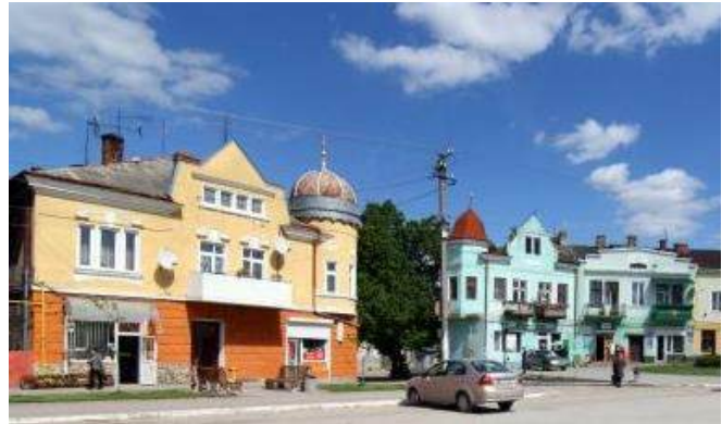
20-ті роки ХХІ ст.