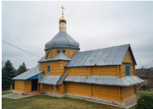
Рис. 7. Церква Спаса [10]

Складовою туристичного потенціалу поселення є й нематеріальна історико-культурна спадщина пов'язана з життям й діяльністю на території поселення відомих особистостей [17], спогадах старожилів поселення.