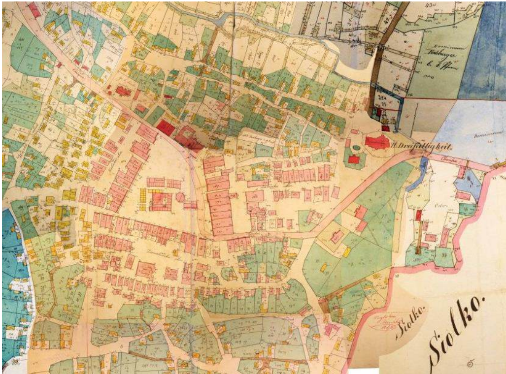
Рис. 3. Центральна частина м. Підгайці на «Podhajce Town Cadastral Map», 1846 [21]

11 ярмарків у рік – це сприяє піднесенню соціально-економічного розвитку поселення, його розбудові (рис. 3). На початку 1870-х років містечку повертають статус міста, створюють однойменну міську гміну [16]. Розвивається соціальна сфера поселення – у місті відкривають школу (1887) та лікарню [16].