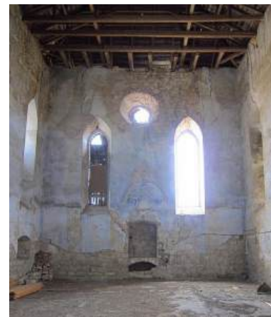
Рис. 4. Синагога у м. Підгайці, Тернопільської області, 2015 [18]