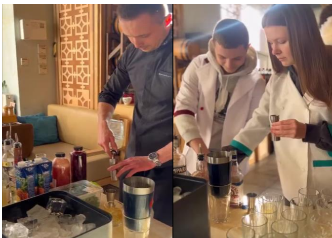
Майстер-клас з приготування коктейлів для здобувачів у ресторані «Чураско»