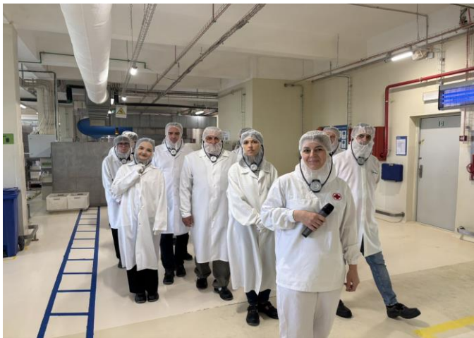
Екскурсія на виробничі об'єкти ТОВ фірми «Світоч ЛТД», що є частиною міжнародної компанії Nestlé