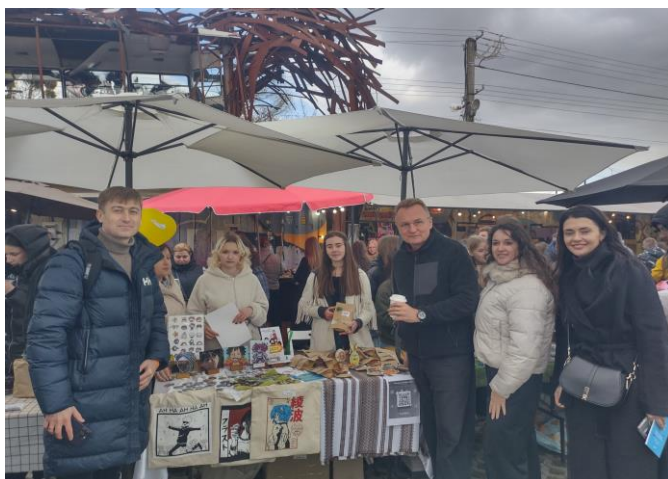
Проект здобувачів кафедри: «Франкові ласощі» на ярмарку «Львів – Молодіжна столиця Європи 2025»