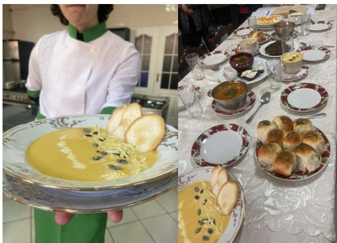
Практичне заняття у лабораторії «Харчових технологій та ресторанного обслуговування»

Метою освітньої програми є підготовка конкурентоспроможних фахівців з харчових технологій, здатних здійснювати професійну діяльність з урахуванням особливостей сучасних харчових виробництв.