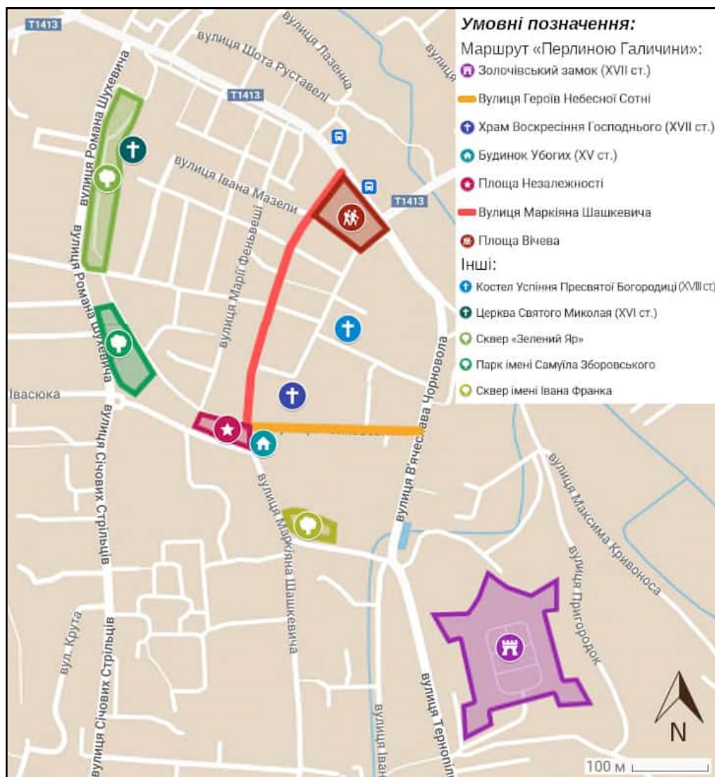
Рис. 4. Рекреаційно-туристичні об'єкти центральної частини Золочева.