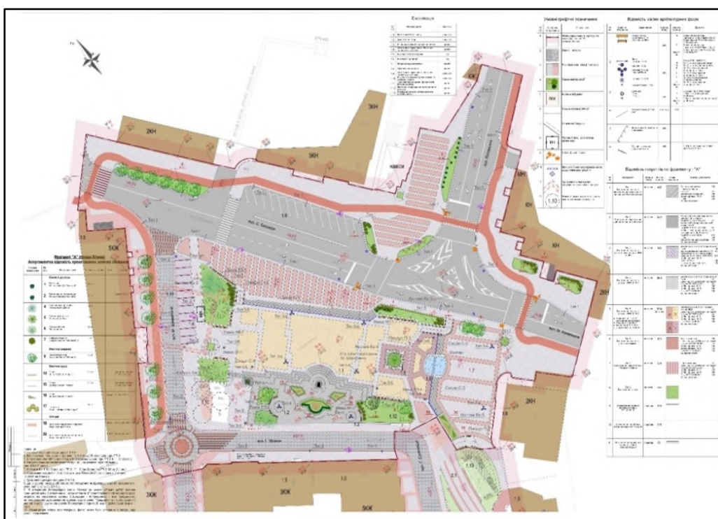
Рис. 2. Проект реконструкції площі Вічевої, вул. М. Шашкевича та прилеглих вулиць 2 . Fig. 2. The reconstruction project of Vicheva Square, Shashkevich St. a and nearby streets.

Найскладнішим завданням була ревалоризація міського центру. Для цього використано визначну дату – в 2011 р. виповнилося 200 років із дня народження Маркіяна Шашкевича, видатного поста, основоположника нової літератури на західних землях України, який народився у с. Підлісся поблизу Золочева. Ця подія відзначалася на державному рівні, зокрема Верховна Рада України прийняла у 2011 р. Постанову № 3303-VI “Про відзначення 200-річчя з дня народження Маркіяна Шашкевича” [14]. У план заходів щодо відзначення ювілею М. Шашкевича вдалося включити проект “Реконструкція площі Вічевої (М. Шашкевича), вул. М. Шашкевича та прилеглих вулиць м. Золочева Львівській області” (рис. 2).