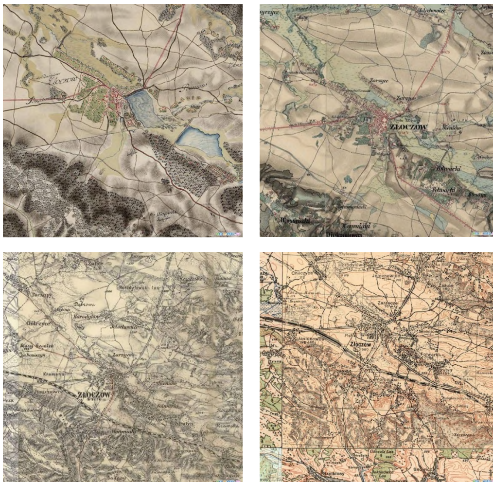
Рис. 1. Золочів на історичних картах (зліва – направо, зверху – вниз: 1779 р. (мапа Фрідріха фон Міга); 1861 р. (мапа “Галичина і Буковина”, 1861–1864 рр. “Друге військове обстеження імперії Габсбургів”); 1887 р.; 1933 р. 1

Fig. 1. Zolochiv on historical maps (rain - to the right, animal - down: 1779 (Friedrich von Mieg's map); 1861 (“Galichyna and Bukovyna” map, 1861-1864 “Second Military Survey of the Habsburg Empire”); 1887; 1933).