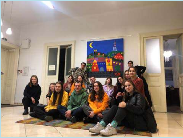
Дружнє фото під час відвідин студентами Центру міської історії у Львові