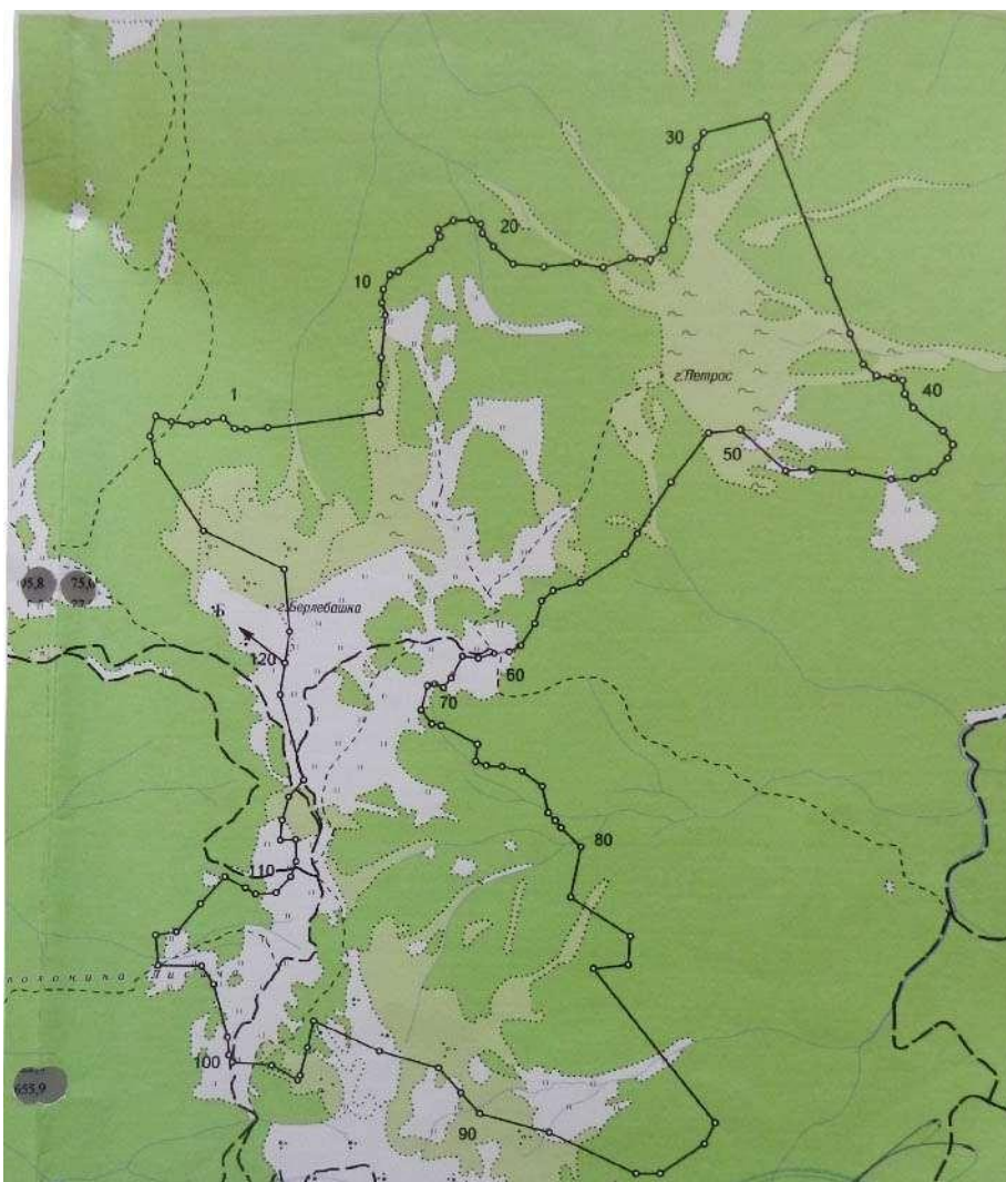
Рисунок 1. Збірний кадастровий план суміжників та землекористувачів земельної ділянки Карпатського біосферного заповідника, що знаходиться на території Видричанської сільської ради Рахівського району Закарпатської області.

Згідно рішення 9 сесії 23 скликання Закарпатської обласної ради від 28.12.1999 р. за №182 та 11 сесії Рахівської районної ради від 14.11.2000р. Карпатському біосферному заповіднику передано у постійне користування земельну ділянку площею 590,1000 га, що розташована на території Видричанської сільської ради (за межами населеного пункту). Це підтверджує державний Акт Серія І-ЗК № 0001680 від 24.11.2000р.