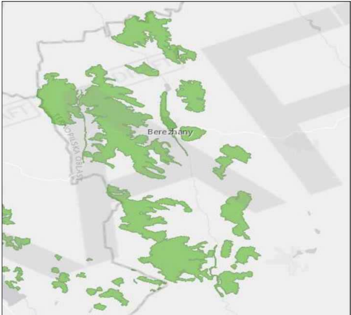
Рис. 4.1. Територія пропонуваного національного природного парку “Бережанське Опілля”, реєстраційний номер № UA0000190) [].

Метою створення Смарагдової мережі Європи є збереження природної фауни, флори та оселищ. Вона була ініційована та координується Бернською конвенцією (1979). Смарагдова мережа має переважно ті самі природоохоронні основи формування, що й НАТУРА-2000, але діє поза межами Європейського Союзу, розвиваючи загальноєвропейські підходи до охорони типів природних оселищ.