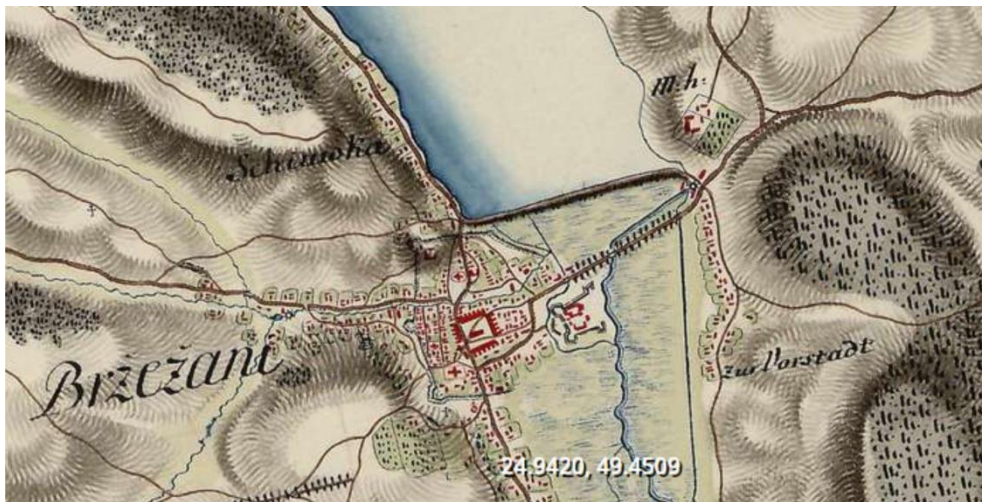
Рис. 3.2. Околиці Березан наприкінці XVIII ст., Йосифінська військова карта Галичини і Лодомерії (т.зв. карта фон Міга), 1779-1782 рр. [11].

У 1848 р. Березани стали центром Окружної Руської ради; створено сотню “руських стрільців”, Національну гвардію. У місті активно діяли ціла низка культурних та освітніх товариств: товариство “Громада” (1870), гурток “Молода Україна” (1898), музично-хорове товариство “Боян” (1892), філія “Просвіти” (1895), “Рідної школи” та “Сільського господаря”. Окрім цього тут діяли “Жіноча громада” (1903), “Пасічна спілка”, sklep-крамниця “Народний дім” (1909), “Учительська громада”, “Сокіл” (1906), “Праця” (1908) [24].