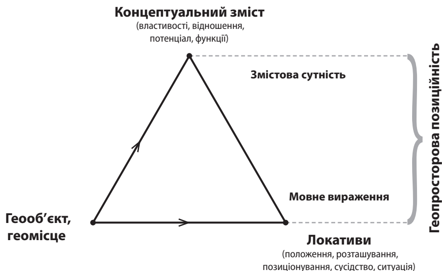
Рис. 3. Семантичний трикутник поняття «Геопросторова позиційність».

Об'єктцентрична і функційна парадигми геопросторової позиційності вирізняються лише гносеологічно, адже геопросторові відношення залежать від властивостей, інтегрального потен-