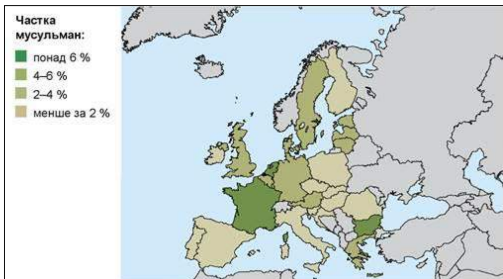
Рис. 2.3. Розподіл арабського (мусульманського) населення у Євросоюзі [6]

Найбільша частка іммігрантів у Західній Європі – 15,6%, тоді як у Східній Європі лише 6,9% від усього населення належать до категорії мігрантів згідно підходів МОМ. Посилення етнічного різноманіття обумовлене притоком мігрантів з-поза меж Європи, тобто інших цивілізаційних регіонів, де населення сповідує інші релігії та й загалом має інші світоглядно-культурні цінності.