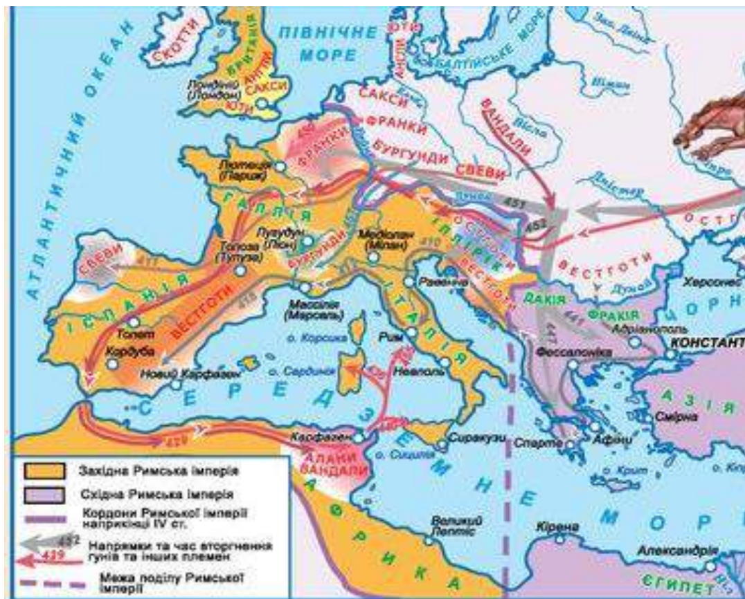
Рис. 2.1. Велике переселення народів [3]

У Стародавній Греції зародилася Західна цивілізація (переважна більшість досягнень політики, науку й культури пов'язані з поглядами, що склалися у східному Середземномор'ї Європи). Велике переселення народів (рис. 2.1) лягло основою формування латинської мовної системи Європи, в основі якої утворилися багато мов Західної Європи. У X тис. до н. е. у Європі проживала половина населення Землі, у 1930-му 25 % (нині близько 9 %).