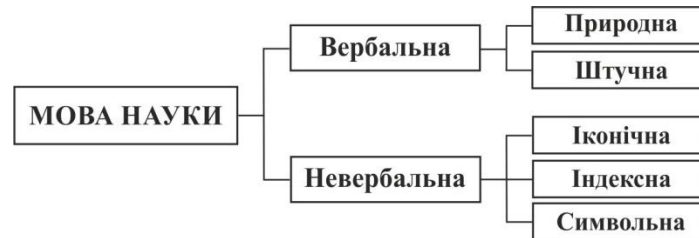
Рис. 2. Модель структури мови науки

Відповідно до структури мовних знаків побудовано модель структури мови науки, що містить вербальну (природну, штучну) та невербальну (іконічну, індексну, символічну) мови (рис. 2).