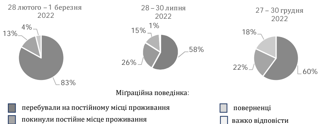
Рис. 1. Міграційна поведінка українців, спричинена війною (побудовано за [3])

щатися за кордон (з 11 до 5 %), а також тих, хто не визначився (з 18 до 13 %). Попри те, що 58 % внутрішніх переселенців були переміщені упродовж перших шести місяців війни, міграційна криза не спадає. Тільки за грудень 2022 – січень 2023 р. внутрішньо переселеними стали 640 тис. осіб, або 12 % від їхньої загальної кількості (найбільший відтік переселенців відбувся у Західному і Центральному макрорегіоні).