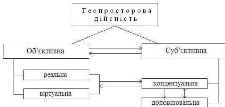
Рис. 2. Логічна модель геопросторової дійсності

фічного, соціально-економічного, геоекологічного, політико-географічного розвитку регіонів і світу загалом тощо. Її об'єктну сферу утворюють також вербальні і візуальні твори мистецтва (література, живопис), у яких відображено Світ у єдності усіх виявів.