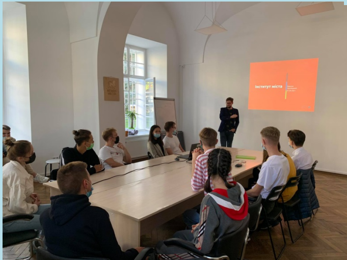
Зустріч студентів з керівництвом Інституту міста – відомим центром стратегічного планування і розвитку Львова

ПІДПИСАНО НОВІ УГОДИ ПРО СПІВПРАЦЮ, ЗОКРЕМА З КОМУНАЛЬНОЮ УСТАНОВОЮ “ІНСТИТУТ МІСТА” У ЛЬВОВІ