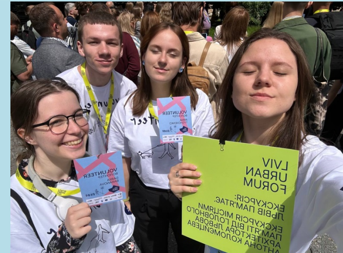
Участь студентів у Міжнародному урбаністичному форумі (Lviv Urban Forum), який відбувся у Львові 28–30 червня 2023 р.

Випускники бакалаврату можуть продовжити навчання в магістратурі. Кращі випускники магістратури отримають можливість поступати в аспірантуру.