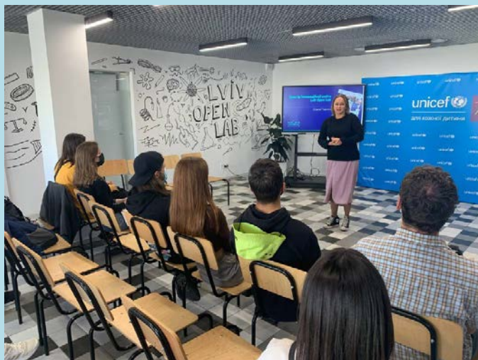
Студенти в Lviv Open Lab – міському молодіжному центрі та просторі популяризації науки та STEAM-освіти

Стратегічність – дає надійний базис знань і вмінь на багато років, що сприяє успішній самореалізації в суспільстві.