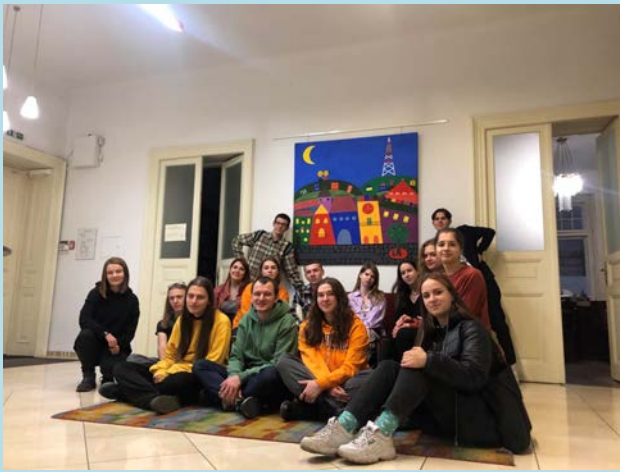
Дружнє фото під час відвідин студентами Центру міської історії у Львові