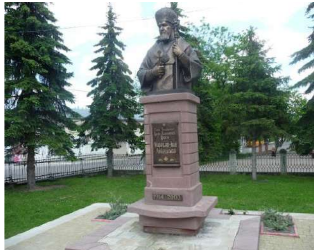
Рис. 7. Пам'ятник Кардиналові Мирославі Любачівському [19]

Собор Успіння Пресвятої Богородиці (УПЦ) споруджено 2001 р. за проектом Є. Рогозова у стилі українського бароко. Екскурсійних туристів він приваблює розміром та особливістю розташування — на пагорбі над дорогою Івано-Франківськ-Стрий поблизу Долинського озера (рис. 8).