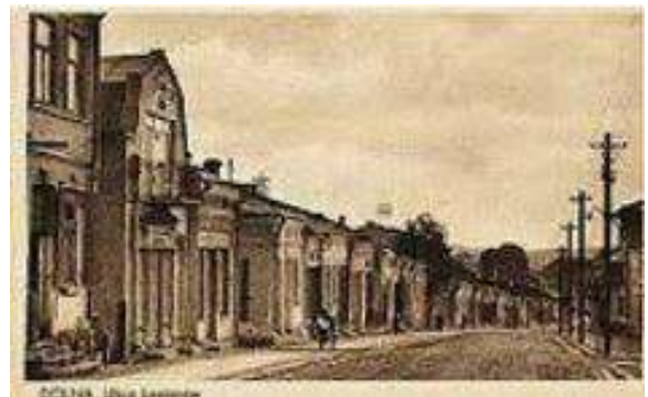
Центральна вулиця міста