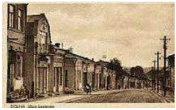
Центральна вулиця міста