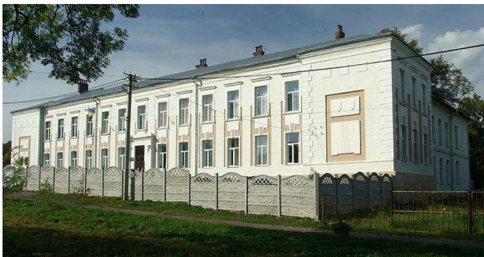
Рис. 11. Долинська гімназія №1 [17]

Цікавим об'єктом екскурсійного туризму м. Долини є архітектурний комплекс старої частини міста сформований на початку ХХ ст. Його окрасою є будівля колишньої польської гімназії імені З. Красінського (1908), де 1911 р. відкрито приватну українську гімназію ім. Маркіяна Шашкевича [12; 17] (рис. 11). Її директором (1911–1922) був етнограф, композитор, письменник М. Пачовський, який похований на старому кладовищі міста. Українська гімназія перебувала під опікою «Просвіти», мала п'ять класів, кабінети вчителів та приміщення канцелярії [11; 17]. Зараз приміщення використовується Долинською гімназією №1.