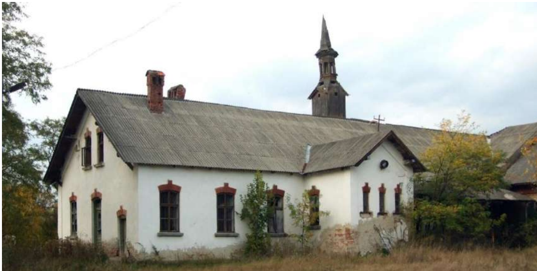
Рис. 10. Будівля солеварні, м. Долина [17]

Цікавим об'єктом екскурсійного туризму м. Долини є архітектурний комплекс старої частини міста сформований на початку ХХ ст. Його окрасою є будівля колишньої польської гімназії імені З. Красінського (1908), де 1911 р. відкрито приватну українську гімназію ім. Маркіяна Шашкевича [12; 17] (рис. 11). Її директором (1911–1922) був етнограф, композитор, письменник М. Пачовський, який похований на старому кладовищі міста. Українська гімназія перебувала під опікою «Просвіти», мала п'ять класів, кабінети вчителів та приміщення канцелярії [11; 17]. Зараз приміщення використовується Долинською гімназією №1.