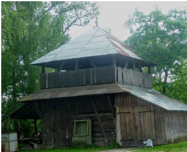
Рис. 6. Дерев'яна дзвіниця [17]

Пам'ятною подією в житті церкви є відправа Святої Літургії (16 квітня 1991 р.) Кардиналом Мирославом Любачівським, який народився в Долині. На згадку про Кардинала на території церкви встановлено пам'ятник (рис. 7). Його постать є основою для створення екскурсійного історико-біографічного туру місцями життя Кардинала у місті Долина.