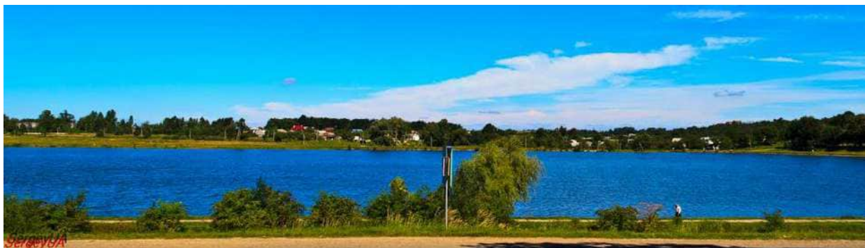
Рис. 2. Долинське озеро [11]

Природо-географічним об'єктом екскурсійного туризму міста є Долинське озеро (рис. 2), яке розташоване на північно-східній околиці поселення при в'їзді з сторони Івано-Франківська. Його площа 25 га, середня глибина 2,5 м [12]. Упродовж року озеро використовується для відпочинку та рекреації місцевими мешканцями та приваблює екскурсантів з довколишніх поселень. На озері розвинуте рибальство, є човни і катамарани, плавають і зимують дикі гуси та лебеді, догляд за якими здійснюють місцеві екоактивісти. Озеро є зоною для молоді, блогерів, туристів, артоб'єктом для місцевих митців.