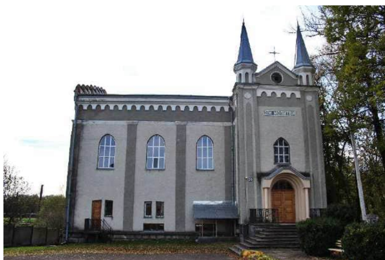
Рис. 9. Синагога, зараз Дім молитви, м. Долина [17]

Туристичним об'єктом індустріальної спадщини міста є будівля солеварні (рис. 10). Це унікальна пам'ятка промислової архітектури датована 1904 р. [12]. Вона постала на місці старих корпусів солеварні-копальні святої Варвари, знищених пожежею 1898 р. [12; 17]. У новому приміщенні були склади (сім відділень) для зберігання солі та упаковки; прокладено рейки для переміщення вагонеток з виварювальних приміщень у складські; канцелярські приміщення; кузня; столярна майстерня тощо. Виварювання солі тут провадилося до початку 90-их років ХХ ст.