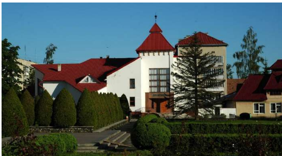
Рис. 12. Краєзнавчий музей «Бойківщина» [28]

Музей «Бойківщина» нанесений на віртуальну музейну карту світу — його експозиція оцифрована, виконано 3D-сканування відділів музею [28], зокрема «Родини Антоновичів». Це робить музей доступним для віртуального відвідування туристами [4] та зацікавлює їх до реального відвідування Долини уже у формі екскурсійного туризму.