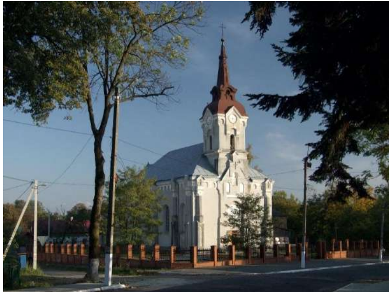
Рис. 3. Костел Різдва Діви Марії [9; 19]