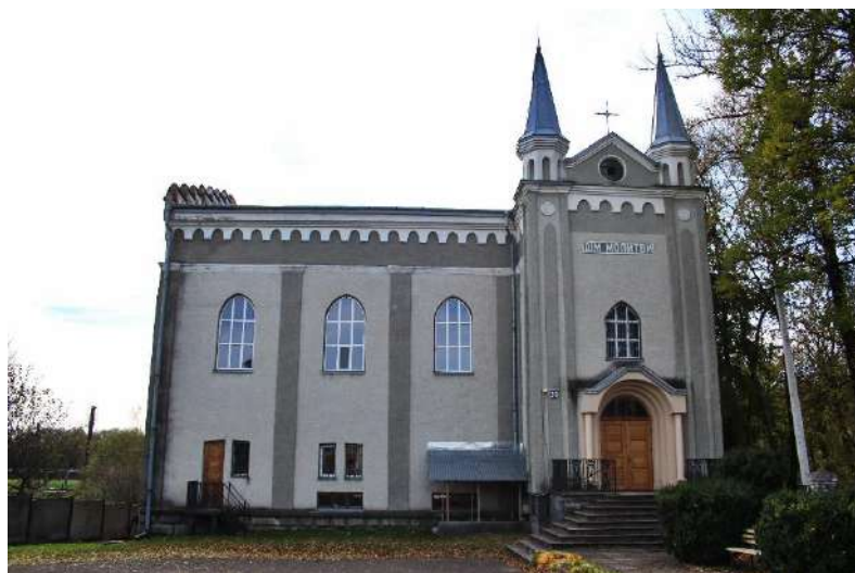
Рис. 9. Синагога, зараз Дім молитви, м. Долина [17]

Туристичним об'єктом індустріальної спадщини міста є будівля солеварні (рис. 10). Це унікальна пам'ятка промислової архітектури датована 1904 р. [12]. Вона постала на місці старих корпусів солеварні-копальні святої Варвари, знищених пожежею 1898 р. [12; 17]. У новому приміщенні були склади (сім відділень) для зберігання солі та упаковки; прокладено рейки для переміщення вагонеток з виварювальних приміщень у складські; канцелярські приміщення; кузня; столярна майстерня тощо. Виварювання солі тут провадилося до початку 90-их років ХХ ст.