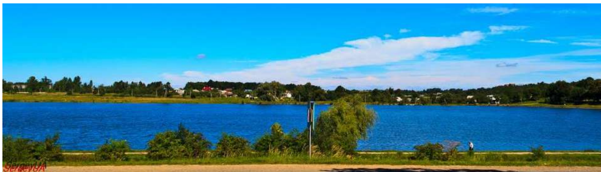
Рис. 2. Долинське озеро [11]

Природо-географічним об'єктом екскурсійного туризму міста є Долинське озеро (рис. 2), яке розташоване на північно-східній околиці поселення при в'їзді з сторони Івано-Франківська. Його площа 25 га, середня глибина 2,5 м [12]. Упродовж року озеро використовується для відпочинку та рекреації місцевими мешканцями та приваблює екскурсантів з довколишніх поселень. На озері розвинуте рибальство, є човни і катамарани, плавають і зимують дикі гуси та лебеді, догляд за якими здійснюють місцеві екоактивісти. Озеро є зоною для молоді, блогерів, туристів, артоб'єктом для місцевих митців.