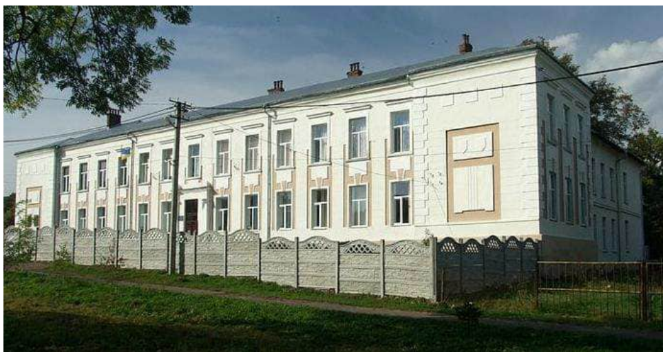
Рис. 11. Долинська гімназія №1 [17]

Цікавим об'єктом екскурсійного туризму м. Долини є архітектурний комплекс старої частини міста сформований на початку ХХ ст. Його окрасою є будівля колишньої польської гімназії імені З. Красінського (1908), де 1911 р. відкрито приватну українську гімназію ім. Маркіяна Шашкевича [12; 17] (рис. 11). Її директором (1911–1922) був етнограф, композитор, письменник М. Пачовський, який похований на старому кладовищі міста. Українська гімназія перебувала під опікою «Просвіти», мала п'ять класів, кабінети вчителів та приміщення канцелярії [11; 17]. Зараз приміщення використовується Долинською гімназією №1.