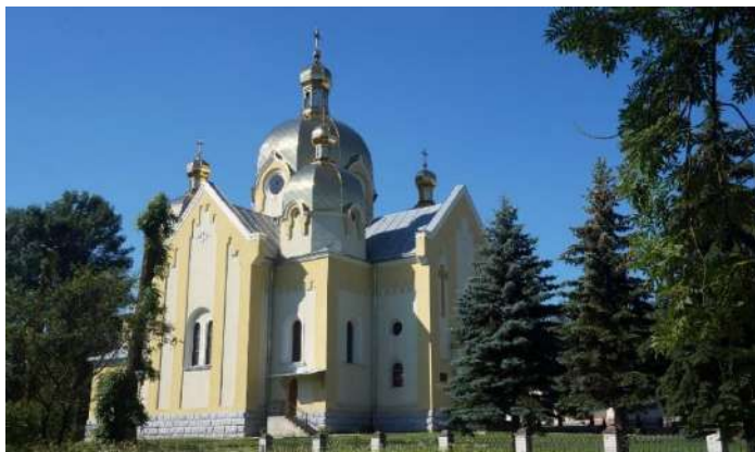
Рис. 4. Церква Різдва Пресвятої Богородиці [9; 19]

рабином і своєю ієрархією вийшли на окраїни міста, аж до залізничної станції, його вітати. Це була дуже знаменна подія» [1, с. 21].