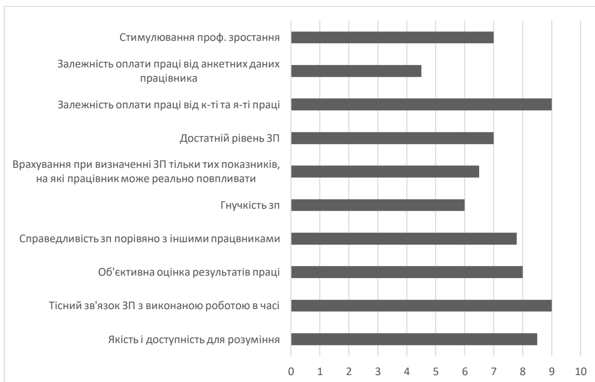
Рис. 2.2. Оцінка критеріїв ефективності системи матеріального стимулювання у ГРК «Жайворонок»