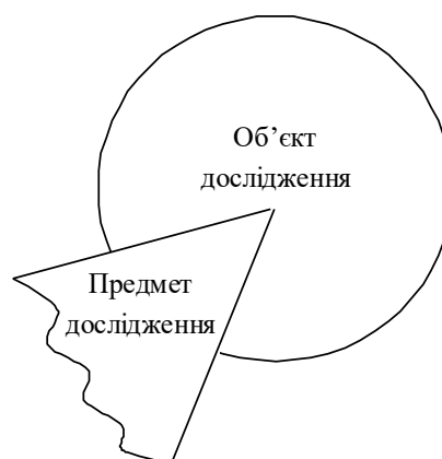
Рис.1.1. Співвідношення між об'єктом і предметом наукового дослідження

Отже, об'єкт слід розглядати як об'єктивно існуючу частину матеріального світу, а предмет – як кут зору на об'єкт, вивчення певних його якостей, властивостей, можливостей використання.