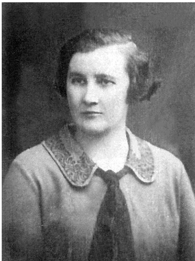
Доктор філософії Олена Степанів (1892-1963)