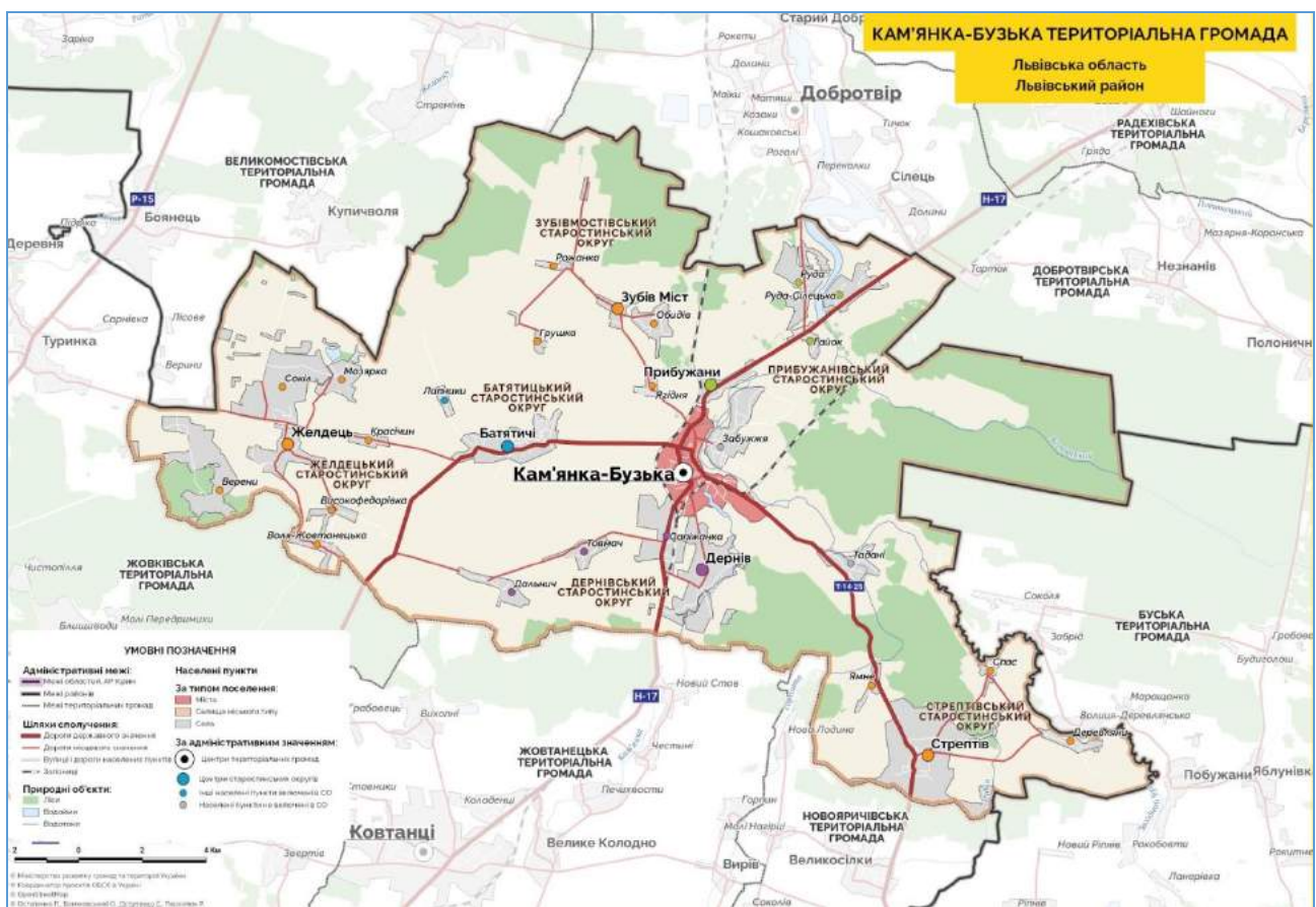
Рис. 1. Розміщення Кам'янка-Бузької територіальної громади [7]

У структурно-тектонічному відношенні Кам'янка-Бузька ОТГ входить до Західноєвропейської молодшої і Східноєвропейської давньої платформ. Громада відноситься до Поліської провінції зони мішаних лісів, а саме областей Бузького і Стирського Малого Полісся [4; 5]. Згідно з фізико-географічним районуванням, в межах Бузького Малого Полісся виділено район Желдецького Полісся, а в межах Стирського Малого Полісся – район Бузько-Бродівського Полісся [5; 6].