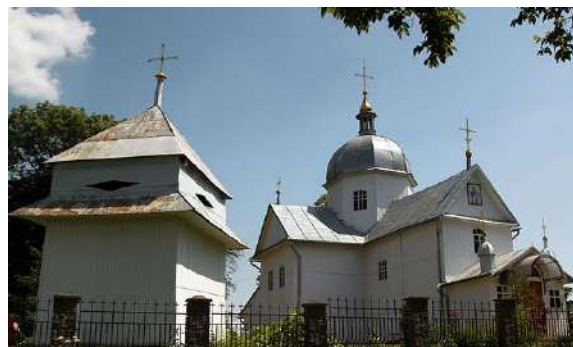
Церква Різдва Пресвятої Богородиці, с. Дидятичі