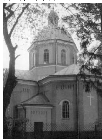
Церква Воздвиження Чесного Хреста, с. Довгомостиська

Рис. 2. Дерев'яні церкви Судово-Вишнянщини [4, 7]