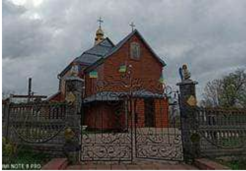
Церква Воздвиження Чесного Животворного Хреста, с. Великі Мокряни

Є. Нагірного. На жаль до сьогодні не збереглася велика баня складної форми й конструкції, що була зруйнована у 1941 р. У 1942-1943 рр. мешканці вкрили наву суцільним дахом з заломом, увінчаним на гребені ліхтарем з маківкою; з північної сторони до вітваря добудували ризницю, із західної до бабинця — невеликий присінок [4, 7]. Ці добудови дещо видозмінили проект Є. Нагірного, але не порушили архітектурну цілісність й естетичну привабливість храму.