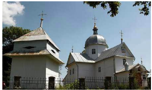
Церква Різдва Пресвятої Богородиці, с. Дидятичі