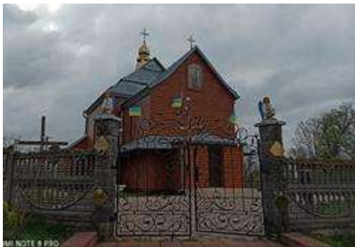
Церква Воздвиження Чесного Животворного Хреста, с. Великі Мокряни

Є. Нагірного. На жаль до сьогодні не збереглася велика баня складної форми й конструкції, що була зруйнована у 1941 р. У 1942-1943 рр. мешканці вкрили наву суцільним дахом з заломом, увінчаним на гребені ліхтарем з маківкою; з північної сторони до вітваря добудували ризницю, із західної до бабинця — невеликий присінок [4, 7]. Ці добудови дещо видозмінили проект Є. Нагірного, але не порушили архітектурну цілісність й естетичну привабливість храму.