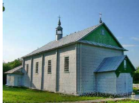
Церква Св. Івана Богослова, с. Малі Мокряни