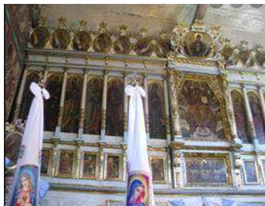
Рис. 1. Церква Св. Миколая (с. Дмитровичі) [4, 7]

Церква Св. Миколая уже залучена до паломницьких маршрутів укладених територією області. Вона є сакральну-історичним об'єктом паломницького шляху «Львівська дорога святого Якова», який розробляє й популяризує кафедра туризму ЛНУ ім. І. Франка. У перспективі може стати окрасою туристичного кільця «Дерев'яні церкви Судово-Вишнянщини».