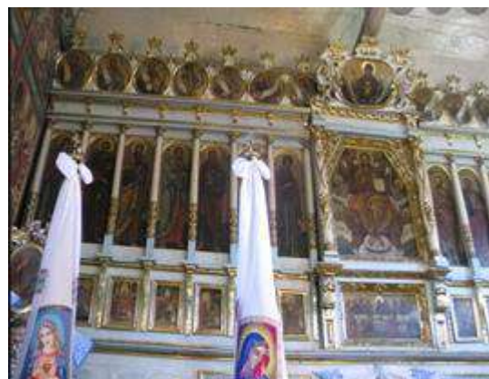
Рис. 1. Церква Св. Миколая (с. Дмитровичі) [4, 7]

Церква Св. Миколая уже залучена до паломницьких маршрутів укладених територією області. Вона є сакральну-історичним об'єктом паломницького шляху «Львівська дорога святого Якова», який розробляє й популяризує кафедра туризму ЛНУ ім. І. Франка. У перспективі може стати окрасою туристичного кільця «Дерев'яні церкви Судово-Вишнянщини».