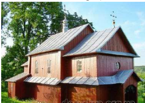
Церква Св. Йосафата, с. Шишировичі