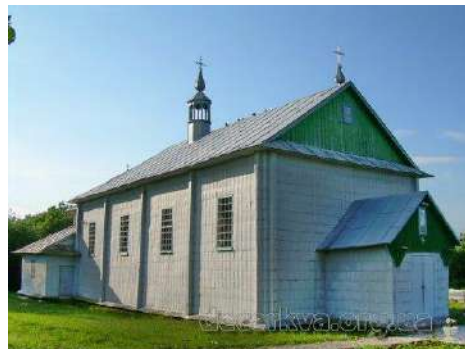
Церква Св. Івана Богослова, с. Малі Мокряни