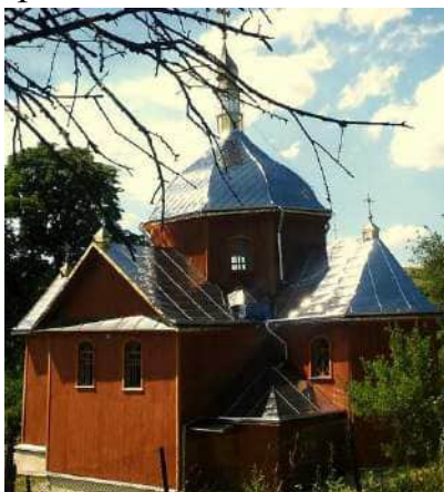
Церква Св. Іллі, с. Вовчищовичі