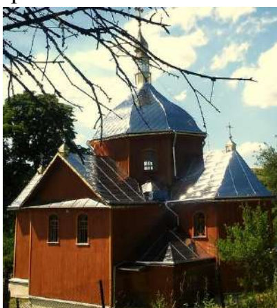
Церква Св. Іллі, с. Вовчищовичі