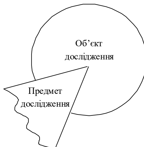
Рис. 3.1. Співвідношення між об'єктом і предметом наукового дослідження

Об'єкт та предмет дослідження як категорії наукового процесу співвідносяться між собою як загальне та часткове (рис. 3.1). У визначенні об'єкту виділяється та його частина, яка виступає предметом дослідження. Саме на нього спрямовується основна увага дослідника. Предмет дослідження визначає спрямування наукової роботи, окреслює її межі.