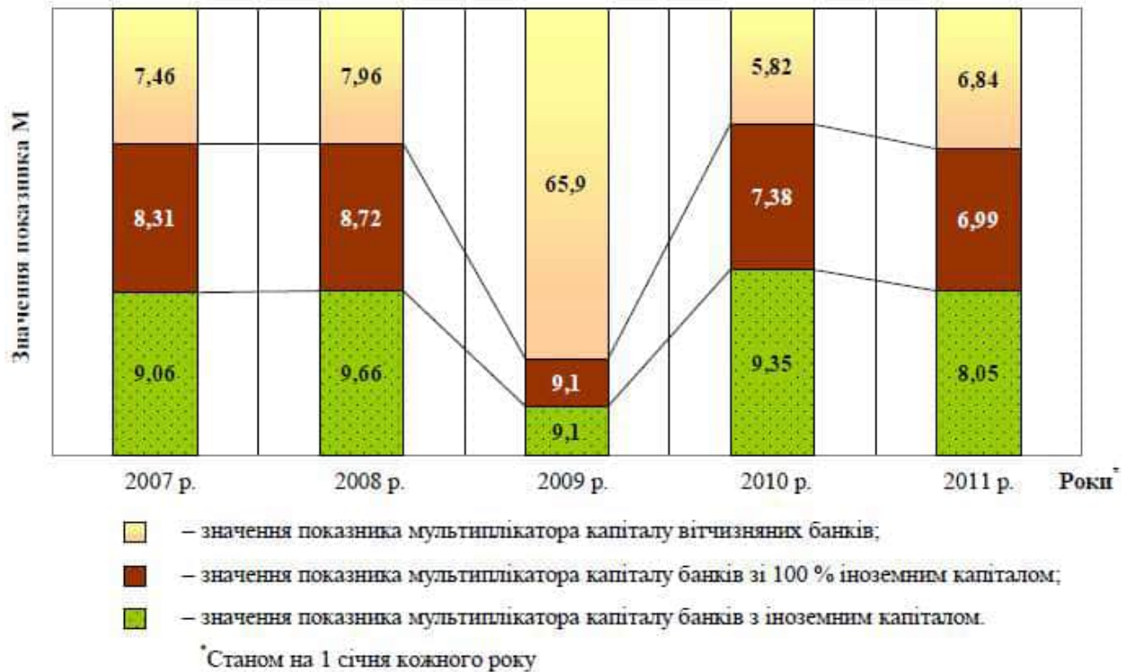
Рис. 2.2 Динаміка значень показника мультиплікатора капіталу (М) у розрізі вітчизняних банків та банків з іноземним капіталом в Україні за 2007–2011 рр.