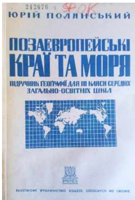
Рис. 12. Обкладинка підручника Ю. Полянського «Позаєвропейські краї та моря», 1938

наочні посібники. Отже, принцип наочності, крім власне спостереження за реальністю, застосовується у різних модельних формах — картографічного моделювання (тут він найбільше віддалений від реальної дійсності), розкриття сутності схем, фотографій і картин та інших засобів;