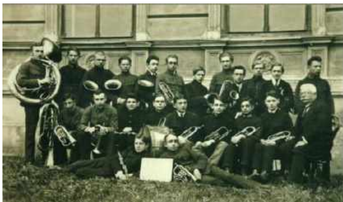
Рис. 6. Учні старших класів гімназії м. Ярослав, 1906 [25]

Можна припустити, що у період навчання в Ярославській гімназії, вплив на формування первинно індивідуальної освітньої, а в подальшому й наукової траєкторії розвитку Юрія Полянського здійснює Ignacy Rychlik (1856–1928) — гімназійний професор історії й географії (1899–1905), історик, краєзнавець, у подальшому директор гімназії (1905–1927), мер Ярослава та посол Віденського парламенту [25]. За його керівництва у гімназії пропагуються активні методики проведення занять на відкритому просторі, стимулювання гімназістів до особистісно-творчого розвитку через долучення до мистецьких спільнот (рис. 6).