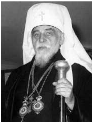
Рис. 11. Ректор Греко-Католицької Богословської Академії, Патріарх Йосиф Сліпий (1892–1984) [3]

З'явилися видання Богословського Наукового Товариства при Богословській Академії: «Богословія», «Нива», «Дзвони», «Мета». Об'єднавши довкола себе провідні кола західноукраїнської інтелігенції, Академія стала центром українського наукового життя» [19].