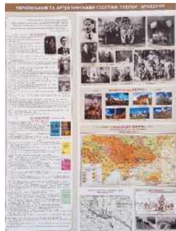
Рис. 5. Інформаційний стенд про Ю. Полянського в аудиторії «Корифеїв географії» на географічному факультеті Львівського університету (на матеріалах проф. О. Шаблія)