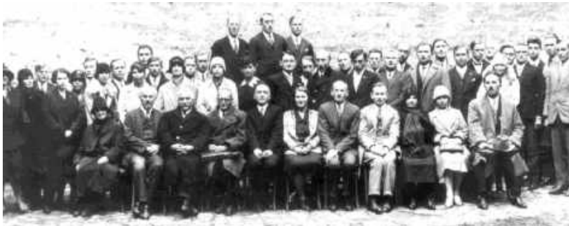
Рис. 2. З'їзд географів Галичини, Львів, 1928