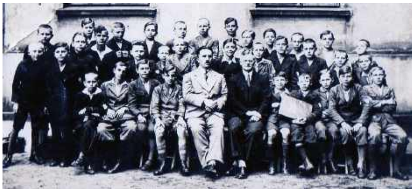
Рис. 9. Учні Академічної гімназії м. Львова. У центрі сидить проф. Ю. Полянський

втратити інтерес при навчанні у школі, не звузити шкільну географію до запам'ятовування номенклатури і показників, а працю учнів — до дослівного відтворення матеріалу підручника), але й загалом — відштовхнути дитину/молоду людину від навчання.