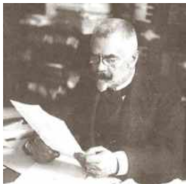
Рис. 8. Професор Ілля Кокорудз (1857–1933) [3]