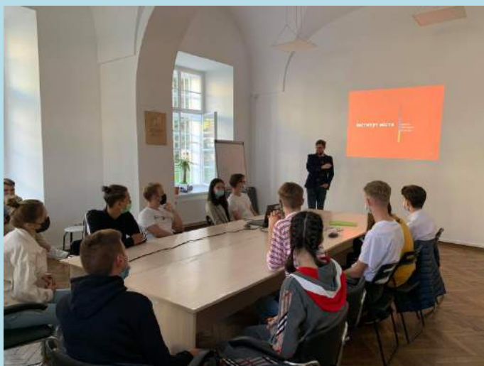
Зустріч студентів з керівництвом Інституту міста – відомим центром стратегічного планування і розвитку Львова

Запроваджена в 2021 р. освітня програма “Урбаністика, просторове планування і регіональний розвиток” за сукупністю показників вступу стала однією з найуспішніших нових бакалаврських Львівського національного університету імені Івана Франка за останні роки. Залежно від показника, вона посідає 1–3 місце, порівняно з іншими новими програмами.