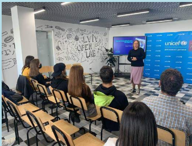
Студенти в Lviv Open Lab – міському молодіжному центрі та просторі популяризації науки та STEAM-освіти

Стратегічність – дає надійний базис знань і вмій на багато років, що сприяє успішній самореалізації в суспільстві.