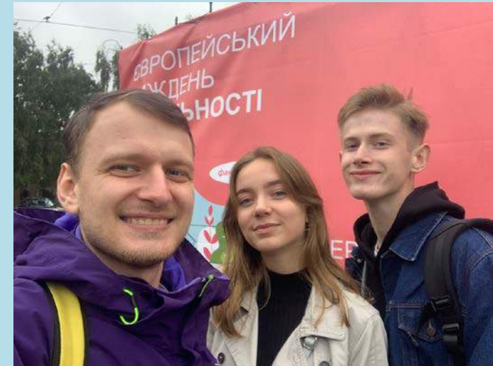
Участь в Європейському тижні мобільності, у заходах з покращення якості природного середовища і умов життя в містах

Випускники бакалаврату можуть продовжити навчання в магістратурі. Кращі випускники магістратури отримають можливість поступати в аспірантуру.