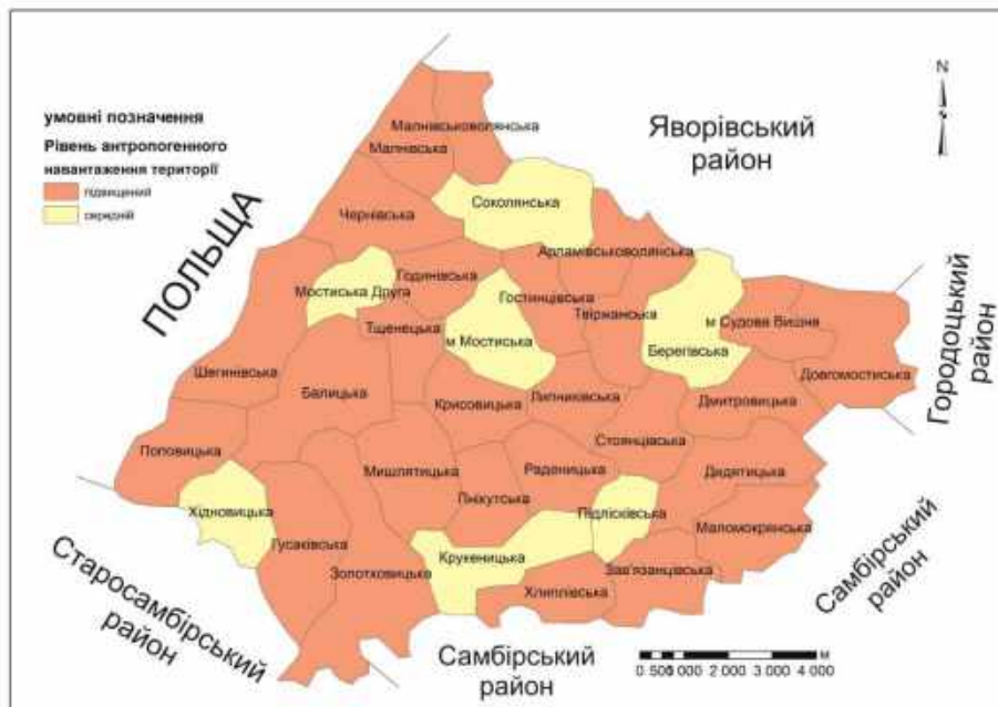
Рис. 3. Рівень антропогенного навантаження на земельні ресурси Мостиського району

Висновки. В останні роки відзначаємо в межах Мостиського району зменшення площ сільськогосподарських земель, спостерігаємо стабілізацію площ земель лісового фонду, значне збільшення площ забудованих земель і земель водного фонду.