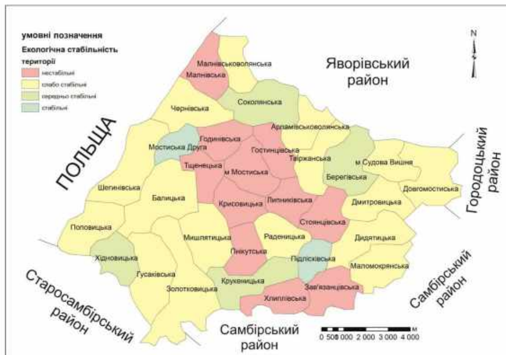
Рис. 2. Екологічна стабільність земель Мостиського району

(0,48), сільських рад та Судововишнянської міської ради (0,50), що розташовані в межах Надсянської рівнини.