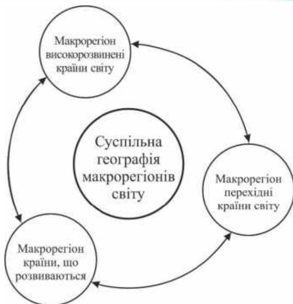
Рис. 1. Структура навчальної дисципліни «Суспільна географія макрорегіонів світу» [7, с. 5]

Зміст структурного елементу «Суспільна географія Центральної, Південно-Східної Європи та Східної Балтії» навчальної дисципліни «Суспільна географія макрорегіонів світу» розроблено на основі сучасних положень щодо підготовки фахівців у сфері географії, норм та традицій вищої університетської освіти («Освітньо-професійна програма підготовки бакалавра Львівського національного університету імені Івана Франка за спеціальністю 106 Географія» [10];), нормативних документів (Закон України «Про освіту», Закон України «Про вищу освіту», стандартів вищої освіти («Стандарт вищої освіти за спеціальністю 106 «Географія» для першого (бакалаврського) рівня вищої освіти», 2020) та ін.), напрацювань кафедри