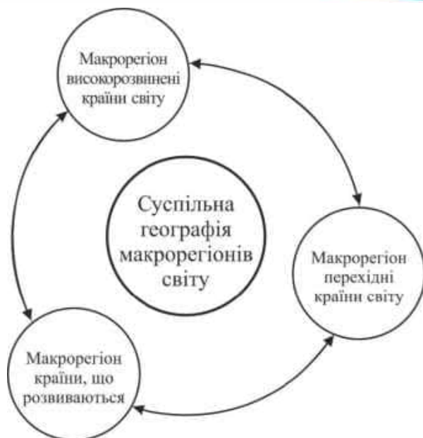
Рис. 1. Структура навчальної дисципліни «Суспільна географія макрорегіонів світу» [7, с. 5]

Зміст структурного елементу «Суспільна географія Центральної, Південно-Східної Європи та Східної Балтії» навчальної дисципліни «Суспільна географія макрорегіонів світу» розроблено на основі сучасних положень щодо підготовки фахівців у сфері географії, норм та традицій вищої університетської освіти («Освітньо-професійна програма підготовки бакалавра Львівського національного університету імені Івана Франка за спеціальністю 106 Географія» [10];), нормативних документів (Закон України «Про освіту», Закон України «Про вищу освіту», стандартів вищої освіти («Стандарт вищої освіти за спеціальністю 106 «Географія» для першого (бакалаврського) рівня вищої освіти», 2020) та ін.), напрацювань кафедри