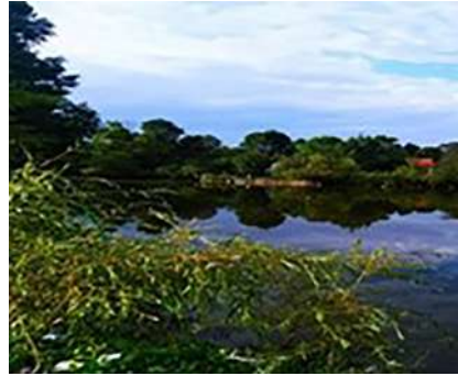
Рис. 1. Краєвиди СВ ОТГ

Наприклад, у с. Дмитровичі туристичною дестинацією історико-культурного, сакрального туризму є Церква Св. Миколая (1655) (рис. 2), дзвіниця та пам'ятний хрест на честь 50-річчя скасування панщини (1898); агротуризму — фермерське господарство «Шеврет».