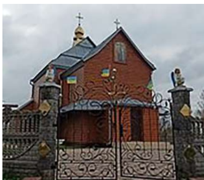
с. Великі Мокряни