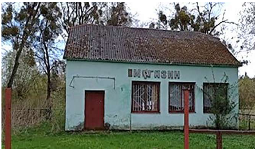
Рис. 3. Стан інфраструктури с. Шишорівці СВ ОТГ