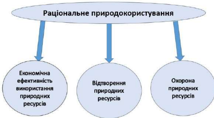
Рис. 1. Головні елементи раціонального природокористування

Раціональне природокористування це свідоме регулювання природогосподарчих зв'язків на економічній основі. Вони базуються на всебічному обліку й оцінці природних ресурсів, їх регулюванні і використанні в господарчому механізмі. Поняття “раціональне природокористування” складається з трьох основних елементів: економічна ефективність використання, охорона і відтворення природних ресурсів (рис. 1).