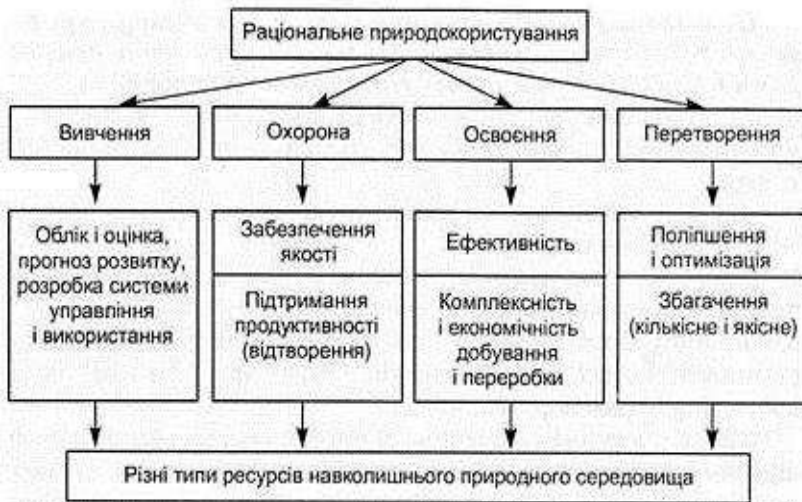
Рис. 2. Головні принципи раціонального природокористування

Раціональне природокористування характеризується загальними принципами, а саме: принципом оптимальності; принципом взаємозалежності суспільства і природи; принципом екологізації виробничої діяльності; принципом збереження просторової цілісності природничих систем, що обумовлено природою різноманіття та обігом речовин у процесі господарчого їх використання; принципом господарського підходу до організації природокористування. Головні принципи раціонального природокористування подано на рис. 2.