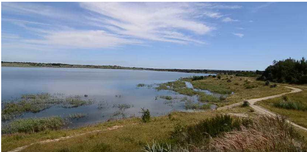
Рис. 3. Водойма на місці Подорожненського кар'єру.

Історико-культурна складова території становить доповнення, урізноманітнення програмного забезпечення водно-туристичних маршрутів Дністром та Свічею. Унікальним потенційним центром історико-культурного, етнічного, ностальгійного, водного туризму є смт Журавно (центр громади), що розташоване неподалік впадіння р. Свіча у р. Дністер.