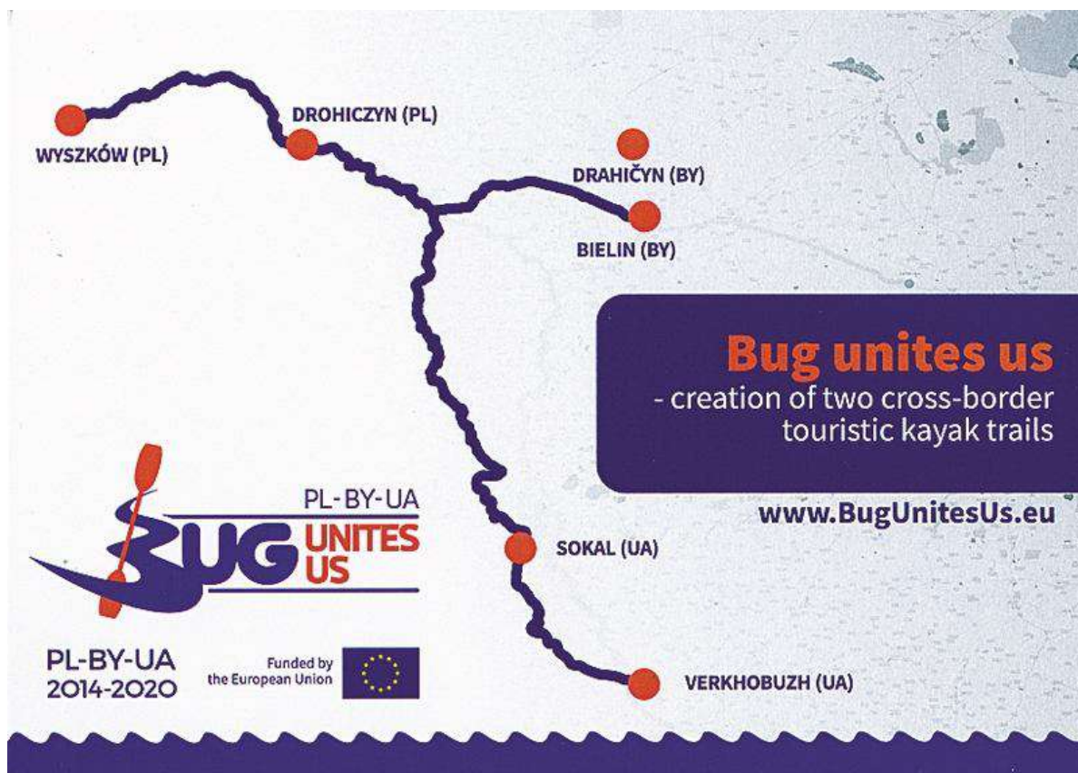
Рисунок. Схема байдаркових маршрутів р. Західний Буг

Загалом проект є дуже цікавим і готує багато родзинок для туристів, які зможуть поринути у чарівний світ природи не лише за допомогою сплаву. У зонах відпочинку вони матимуть можливість насолоджуватись звуками живої природи, а завдяки оглядовій вежі побачать мальовничі місця Західного Бугу. Для дітей буде розроблена комп'ютерна гра, яка дозволить їм у віртуальному просторі пройти весь маршрут по річці.