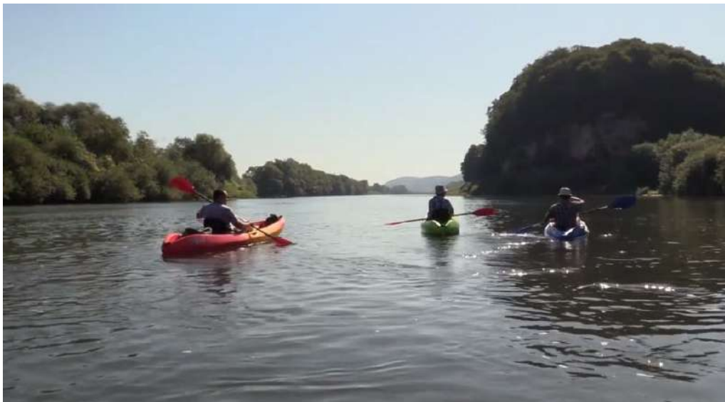
Рис. 4. Сплав річкою Дністер в околиці урочища Бакоцино.

2. Урочище Бакоцинський ліс, унікальне багатством флори і фауни.