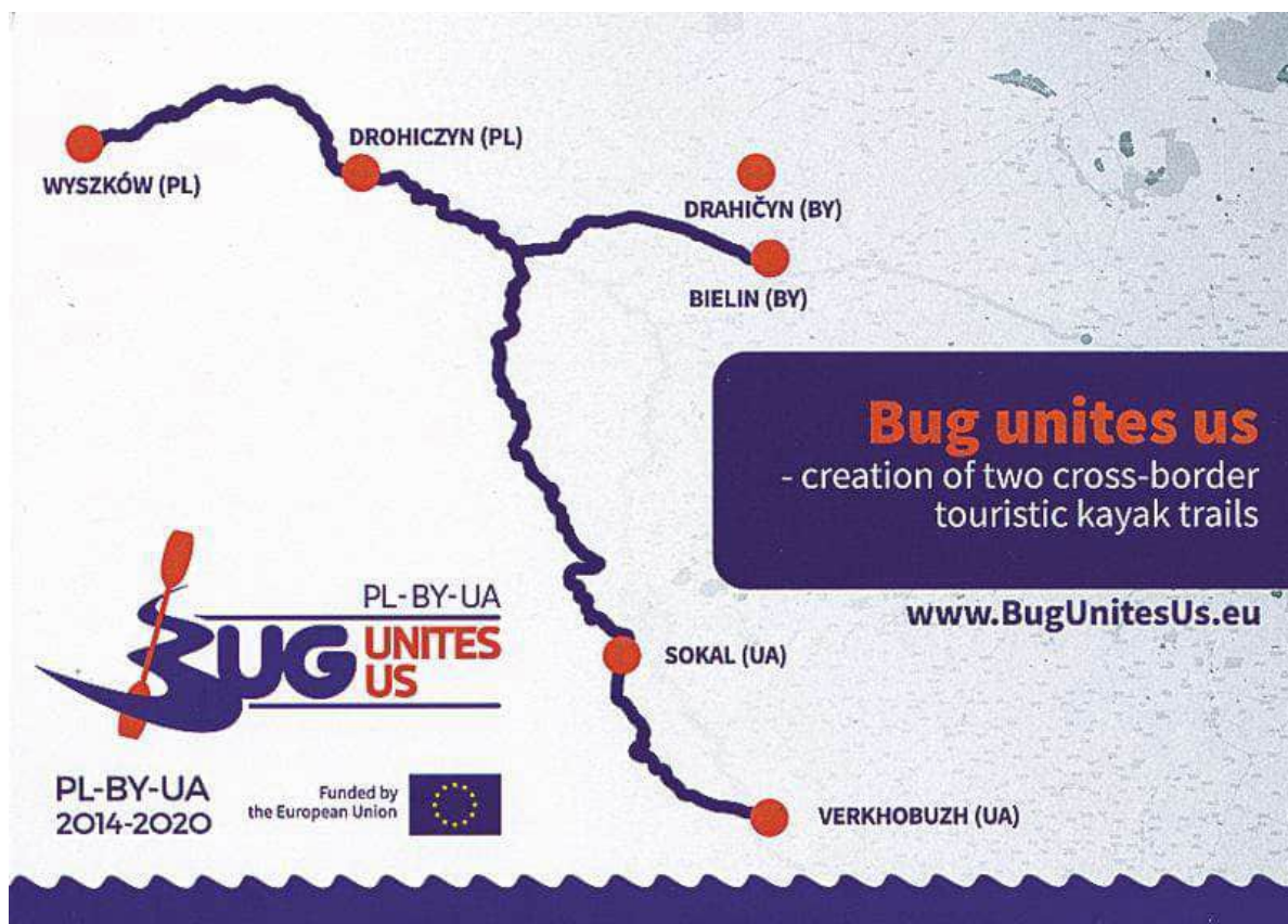
Рисунок. Схема байдаркових маршрутів р. Західний Буг

Загалом проект є дуже цікавим і готує багато родзинок для туристів, які зможуть поринути у чарівний світ природи не лише за допомогою сплаву. У зонах відпочинку вони матимуть можливість насолоджуватись звуками живої природи, а завдяки оглядовій вежі побачать мальовничі місця Західного Бугу. Для дітей буде розроблена комп'ютерна гра, яка дозволить їм у віртуальному просторі пройти весь маршрут по річці.