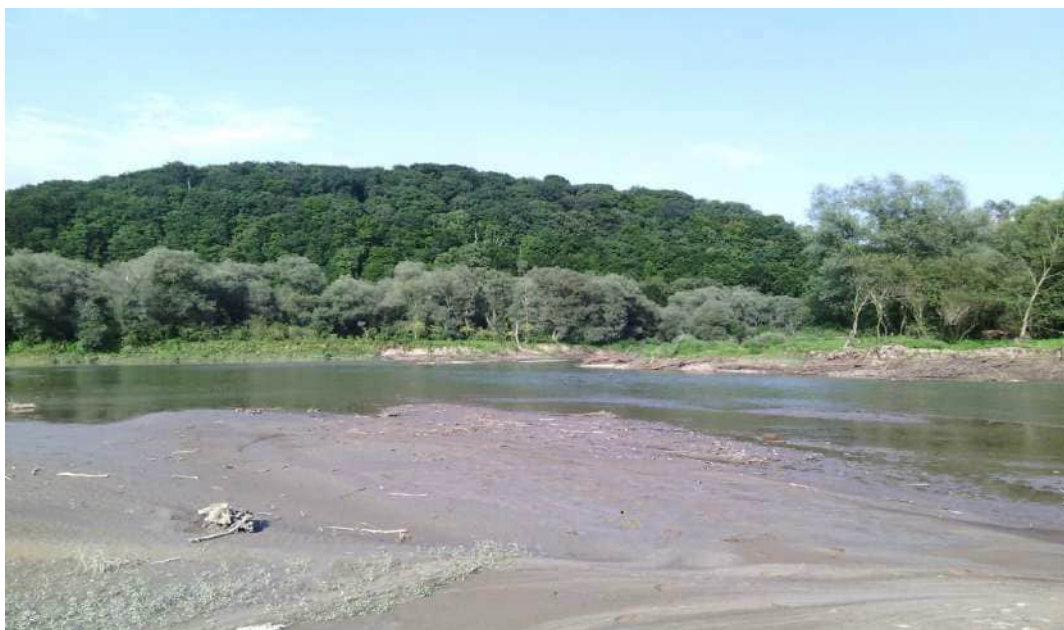
Рис. 2. Місце впадіння р. Свіча у р. Дністер, на задньому плані – урочище Бакоцино.

Живляться ріки в основному дощовими і талими водами. Режим річок району - повеневий. Ймовірні три підняття рівнів води: літні повені (від випадання тривалих літніх дощів) – найбільші за рівнем води; весняна повінь (від танення снігу) – величина якої в останні роки дуже незначна; зимові повені внаслідок раптових відлиг (за величиною значно поступаються рівню літніх повеней).