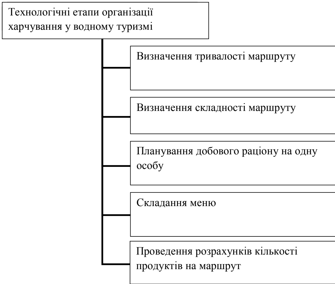
Рис. Основні технологічні етапи організації харчування у водному туризмі

При розробці меню складають добовий раціон. При цьому слід врахувати: