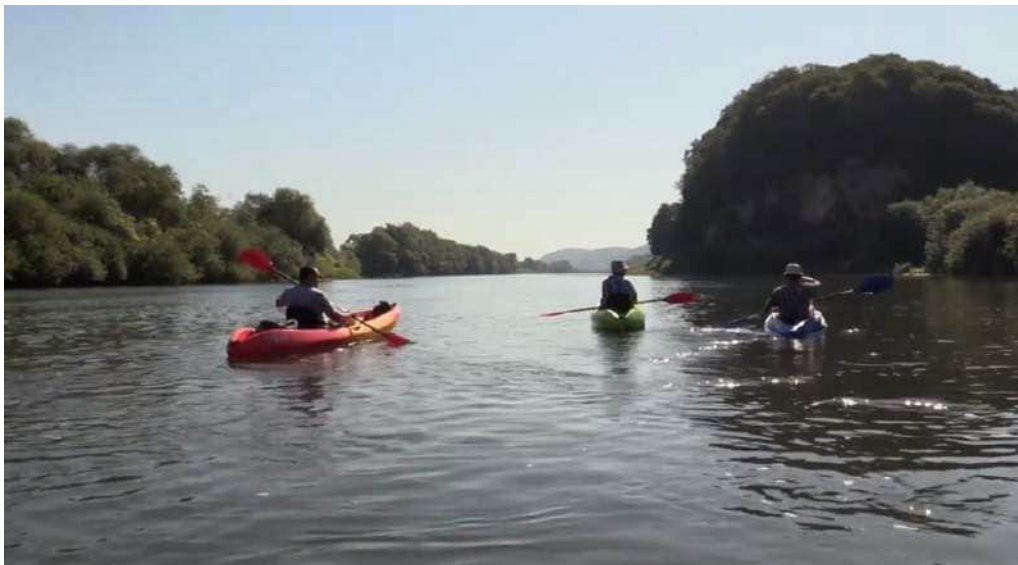
Рис. 4. Сплав річкою Дністер в околиці урочища Бакоцино.

2. Урочище Бакоцинський ліс, унікальне багатством флори і фауни.