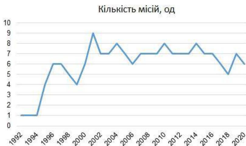
Рис. 2. Участь України в миротворчих місіях ООН

У середньому український персонал задіяний у 6 миротворчих місіях щороку; максимальна кількість місій, де залучені українські представники припадає на 2001р. – 9 місій; мінімальна – на початкові роки співпраці держави з ООН: 1992-1994 рр. участь в одній місії. З 2014 р., через розв'язанням воєнних дій на сході держави, участь країни у миротворчих місіях ООН скорочується (Рис. 2).