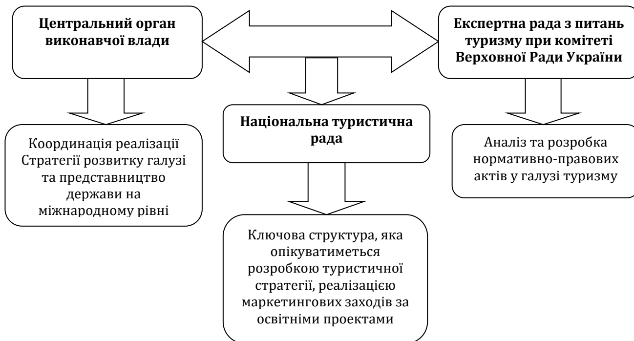
Рис. 2. Модель державного управління у галузі туризму

Першими етапами на шляху удосконалення чинної моделі державного управління в галузі туризму в Україні повинні стати створення Національної туристичної ради, спеціалізованого центрального органу виконавчої ради (самостійного або в складі Міністерства економічного розвитку і торгівлі України), який буде займатися формуванням та реалізацією стратегії розвитку туризму й державної політики в сфері туризму, та Експертної ради з питань туризму при комітеті Верховної Ради України (рис. 2).