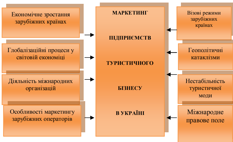
Рис. 1. Система мегафакторів, що впливають на маркетинг туристичних підприємств України (складено автором на основі [12]).

обслуговування саме внутрішніх і виїзних туристів, тоді як сфера в'їзного туризму залишається комерційно непривабливим видом туристичної діяльності. Про це свідчать і результати маркетингового дослідження. Зокрема, 40,6 % суб'єктів підприємництва Львівщини головним напрямом туристичної діяльності вважають внутрішній туризм, 35,9 % опитаних туроператорів зазначило, що для них пріоритетним видом діяльності на ринку туристичних послуг України є сфера виїзного туризму, і тільки 23,5 % суб'єктів господарювання зазначило, що спеціалізуються на обслуговуванні в'їзних туристів.