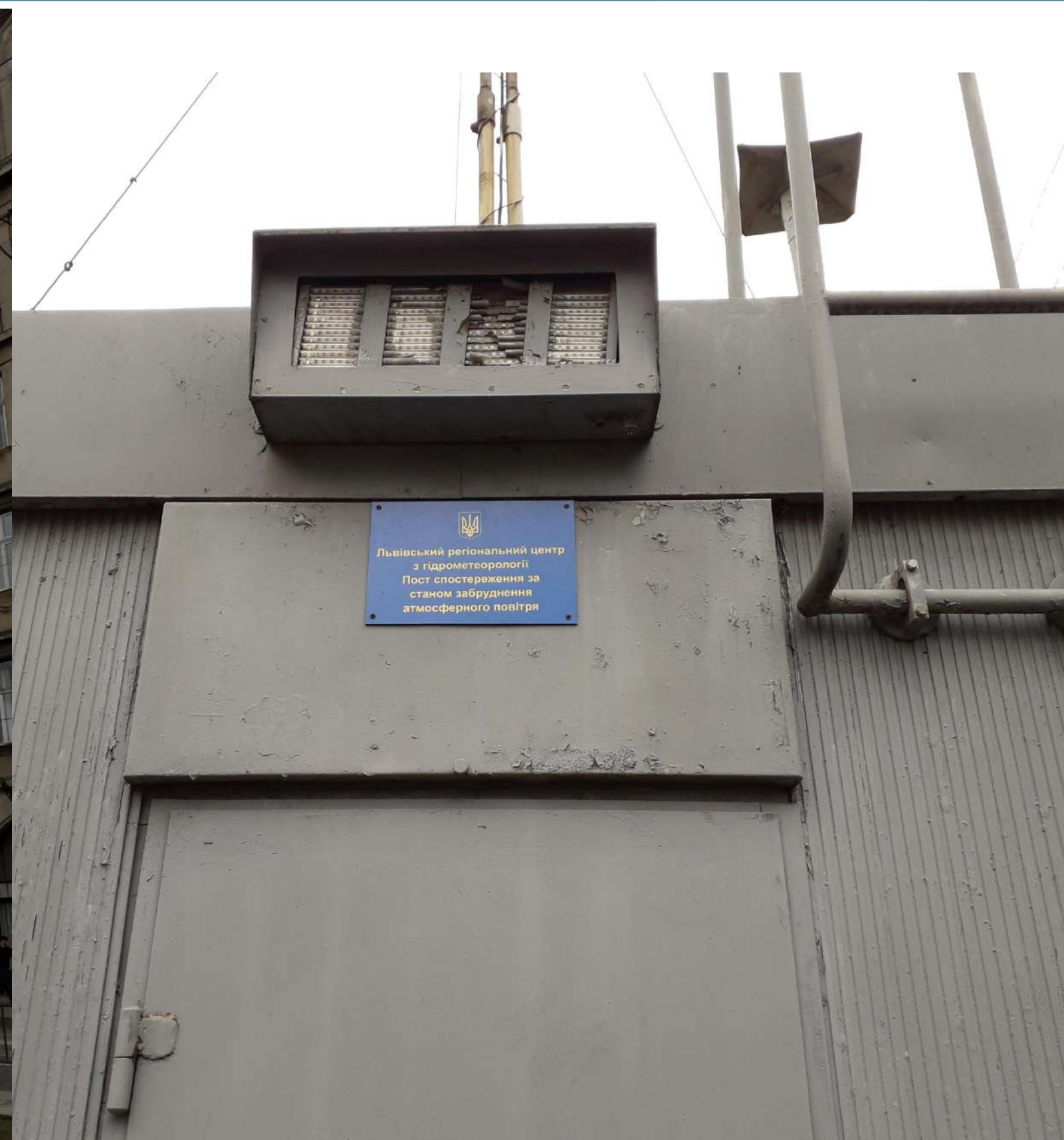
Пост спостережень за станом забруднення АП Львів, пл. Соборна