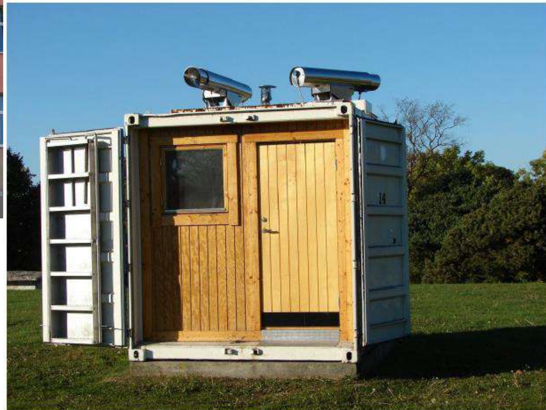
Станція для моніторингу якості атмосферного повітря методом LIDAR (Рига, Латвія)