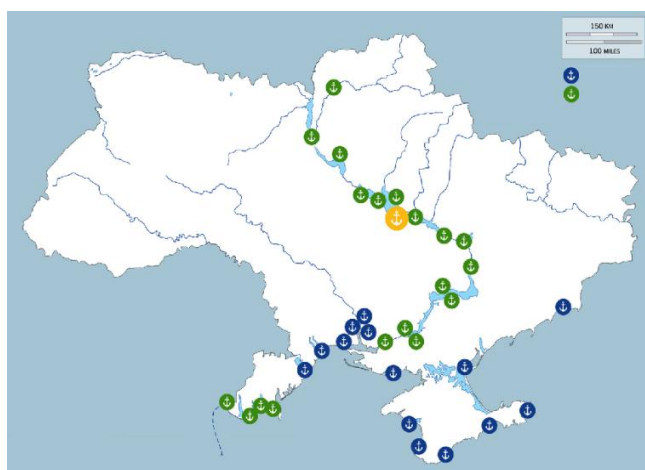
Рис.1. Морські порти України Рис. 2. Внутрішні водні шляхи України

Слід зазначити, що протяжність водних шляхів, якими здійснюється судноплавство, порівняно із 1990 роком скоротилась вдвічі – з 4 тис.км до 2 тис.км. А протяжність водних шляхів із гарантованими глибинами скоротилася з