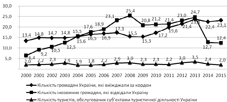
Рис. 2. Динаміка туристичних потоків в Україні, млн осіб.