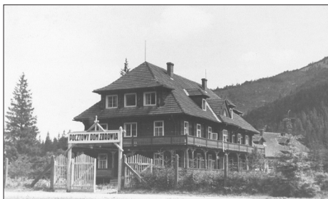
Fot. 2. Hrebenów. Poczty Dom Zdrowia, 1930 r.