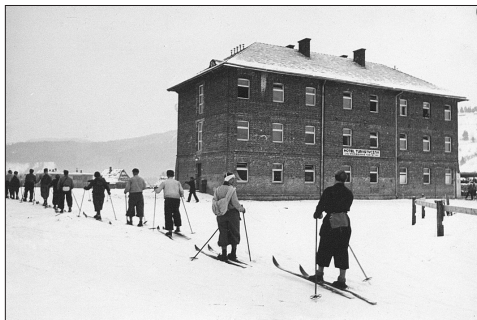
Fot. 1 Sławsko. Hotel turystyczny Ligii Popierania Turystyki, 1937 r., (fot. Henryk Poddębski)

Hrebenów przyciągał turystów jako stacja klimatyczna i letnisko górskie (początkowo prywatne). Walory klimatyczne, śródgórskie położenie nad Oprem i dobra dostępność komunikacyjna stanowiły pierwszorzędne walory tej miejscowości, która od połowy lat 30. była dobrze zagospodarowana na potrzeby turystyki wypoczynkowej. Ruch budowlany nasilił się bardzo po 1923 r., kiedy to znacznych rozmiarów pożar „uwolnił” tereny pod wzniesienie murowanych, większych budowli noclegowych. Drugim bodźcem było ustanowienie komisji klimatycznej i możliwość poboru taksy. Największym obiektem w tej