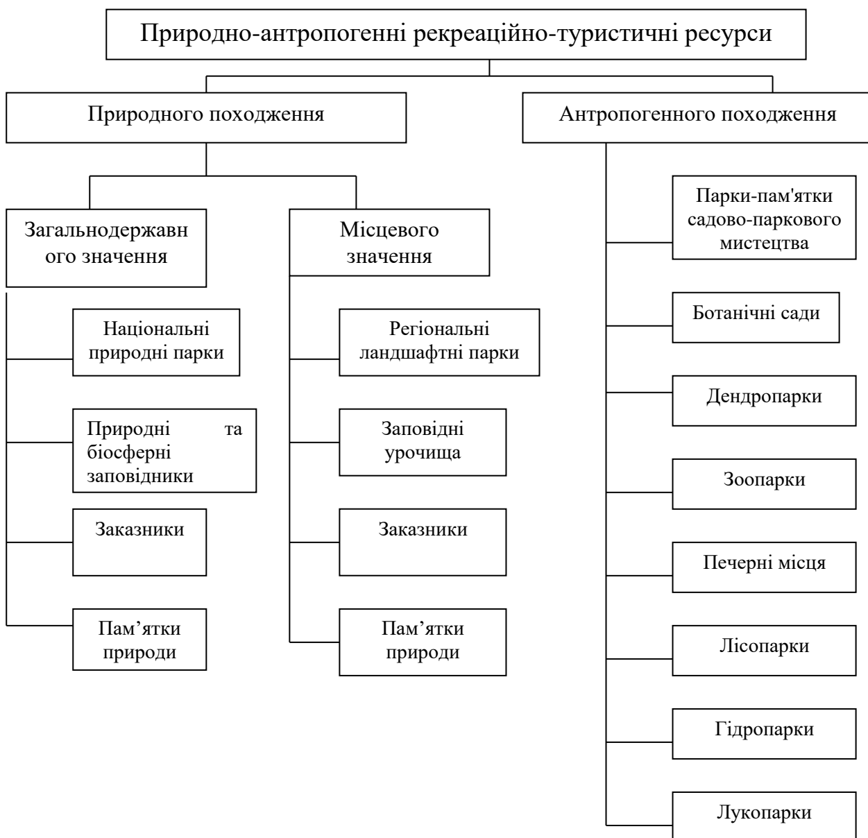
Рис. 5.1. Структура природно-антропогенних рекреаційно-туристичних ресурсів

У Законі України «Про природно-заповідний фонд України» подано класифікацію територій та об'єктів ПЗФ України (стаття 3) та форми власності на території та об'єкти природно-заповідного фонду (стаття 4). До складу природно-заповідного фонду України входять як природні, так і штучно створені території та об'єкти. За О. О. Бейдиком природно-заповідні об'єкти або природно-антропогенні рекреаційно-туристичні ресурси – це геосистеми, до складу яких входять як природні так і антропогенні об'єкти, що використовуються в туристично-рекреаційному господарстві. Структура природно-антропогенних РТР відображена на рис. 1.