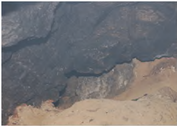
Рисунок 1.12 – Стінки вхідного залу