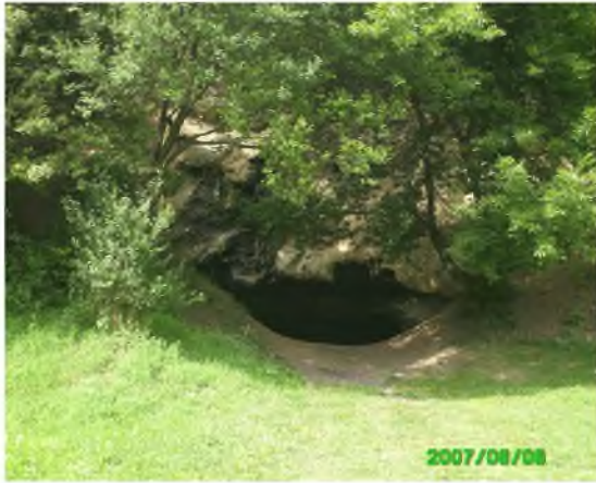
Рисунок 1.10 – Головний вхід у печеру