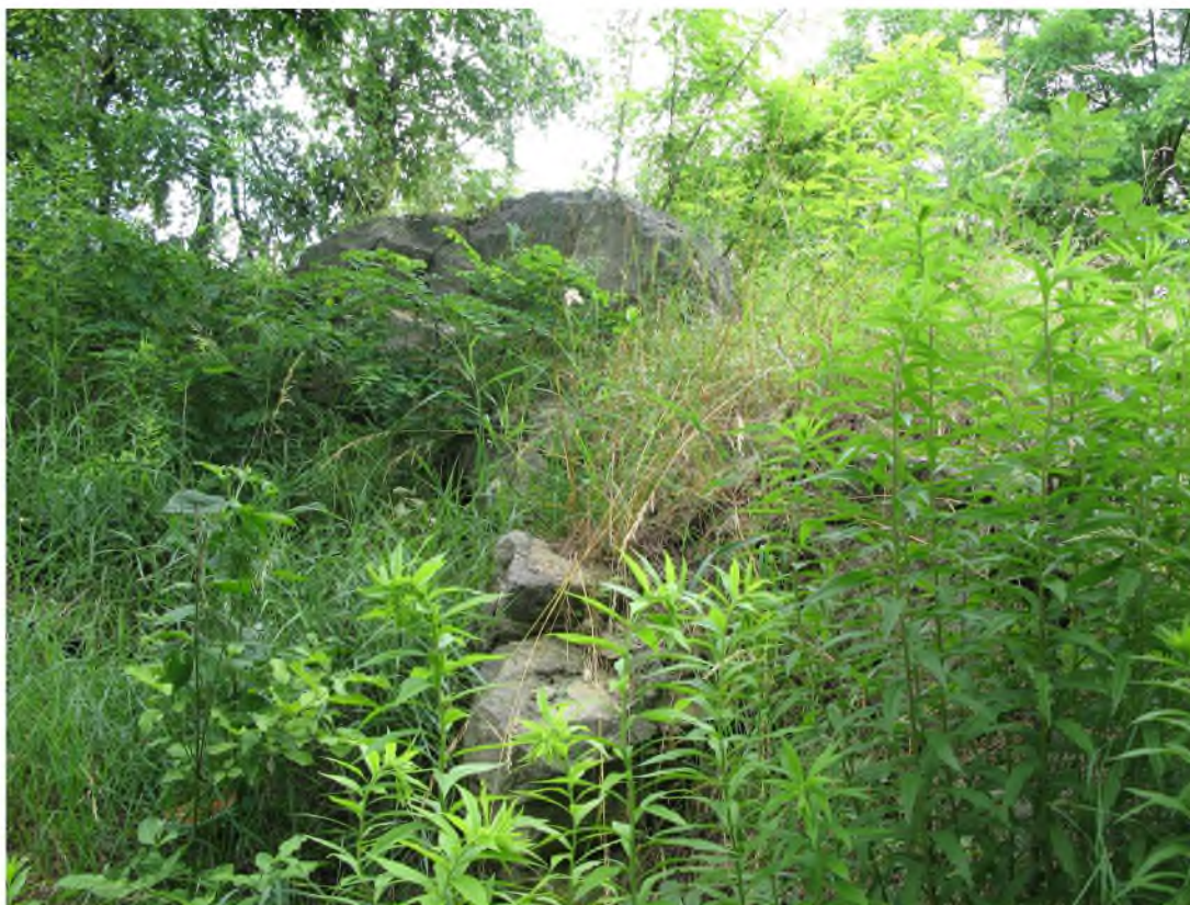
Рисунок 1.15 – Залишки брил пісковика на місці описаного М. Ломніцьким геологічного відслонення