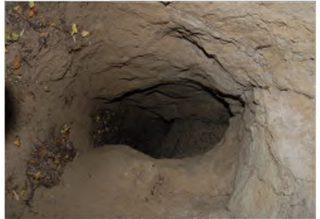
Рисунок 1.11 – Другорядний вхід у печеру