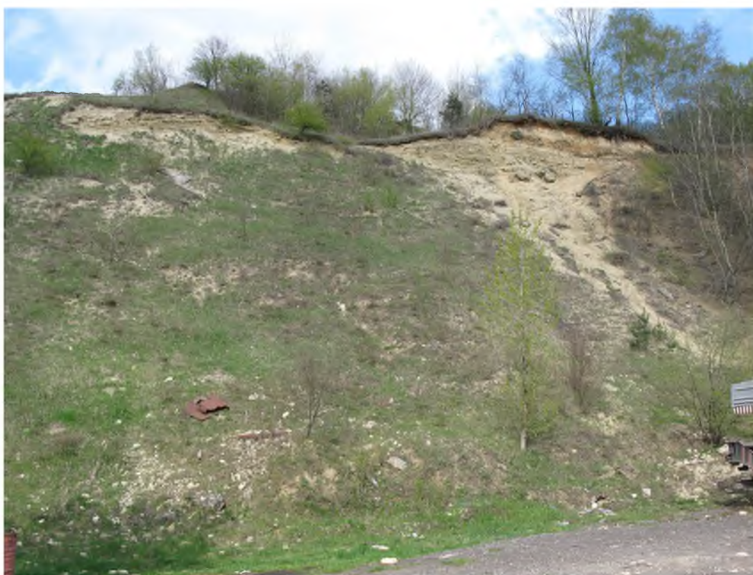
Рисунок 1.16 – Кар'єр на південному схилі Кортумової гори