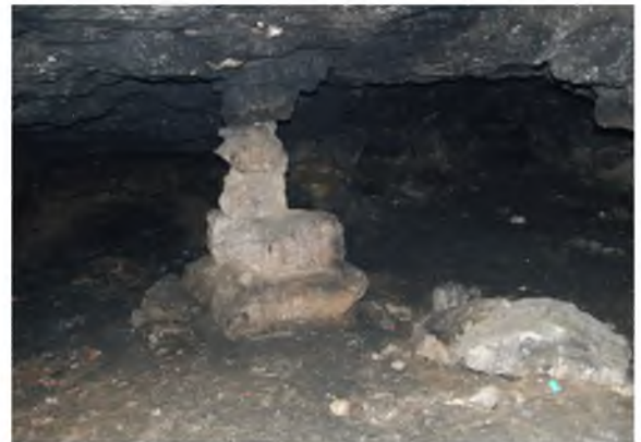
Рисунок 1.13 – Колона у вхідному залі