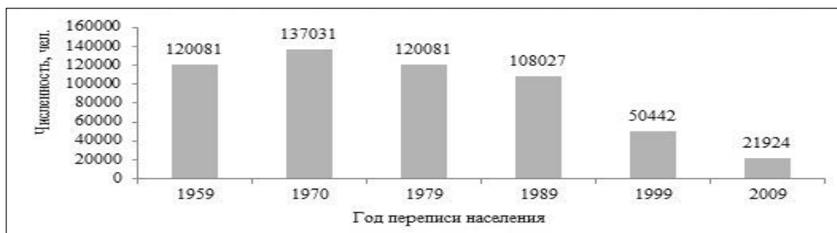
Рис. 4 – Динамика численности украинцев в Кыргызстане за переписями населения [13, С. 91–100].

Значительные за объемами миграции украинцев в Кыргызстан происходили в 30–50-х гг. XX в., которые приходятся на сталинские репрессии и эвакуацию украинцев в годы Второй мировой войны, индустриализацию страны, которая осуществлялась путем привлечения квалифицированных рабочих и специалистов из России и Украины [12, с. 267]. Украинцы заселяли, прежде всего, Чуйскую и Таласкую долины, меньше восточную часть Иссык-Кульской низменности и Ферганскую долину. После 1989 г. в стране проведены две переписи населения: 1999 и 2009 гг. В Кыргызстане состоялось значительное сокращение численности украинской диаспоры за период между переписями 1989 и 1999 гг. – на 57585 чел. (53,3%), за 1999-2009 гг. – на 28518 чел. (56,5%). Таким образом, в течение 20 лет численность украинской диаспоры в Кыргызстане уменьшалась более чем вдвое (рис. 4).