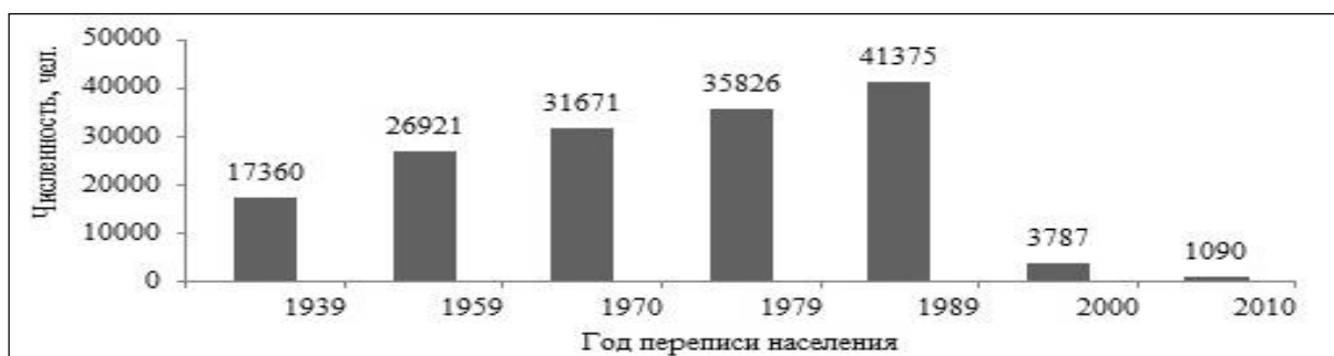
Рис. 5 – Динамика численности украинцев в Таджикистане за переписями населения

Таджикистан. Формирование украинской диаспоры происходило преимущественно после окончания Второй мировой войны. Эмиграция мигрантов в страну вызвана ускоренной индустриализацией страны. Численность украинцев в стране возрастала до 1989 г., после чего уменьшилась в 38 раз (рис. 5) [2].