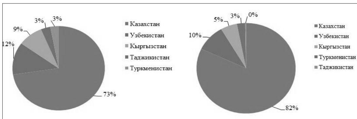
Рисунок 1. – Удельный вес от всей украинской диаспоры в разрезе стран Центральной Азии в конце 80-х – начале 2010-х гг. [2-6; 8, С. 119-131; 9-10; 14-15].

С момента проведения в 1989 г. переписи населения в Советском Союзе численность украинской диаспоры в странах Центральной Азии значительно сократилась. За результатами переписи на 1989 г. в странах Центральной Азии проживало 1234417 украинцев, из которых 896 240 человек проживало в Казахстане (72,6 % от всей украинской диаспоры в регионе), 153197 – Узбекистане (12,4), 108027 – Кыргызстане (8,75), 41375 – Таджикистане (3,35) и 35578 – Туркменистане (2,9). На начало 2010-х годов Казахстан по-прежнему остается лидером за численностью украинской диаспоры, а украинская диаспора в Таджикистане за результатами переписи 2010 г. наименее численная в регионе Центральной Азии. Согласно результатам переписи населения 2009 г. в Казахстане и Кыргызстане как украинцы идентифицировалось 333031 и 21924 человека соответственно, в Таджикистане – 1090 (2010 г.), в Туркменистане – 11 тис., Узбекистане – 39 тис. украинцев (оценочные данные). Состоянием на раунд переписей 2010 г. в странах региона проживало 406 тыс. украинцев, что составляет 39,2% от численности украинцев за переписью 1989 г. За период конца 80-х XX в. – начала 2010-х гг. структура украинской диаспоры в регионе изменилась (рис. 1). В разрезе стран увеличился удельный вес украинской диаспоры, которая проживет в Казахстане, за счет большего уменьшения численности украинской диаспоры в других странах, незначительно изменился в Туркменистане и в 12 раз уменьшился в Таджикистане.