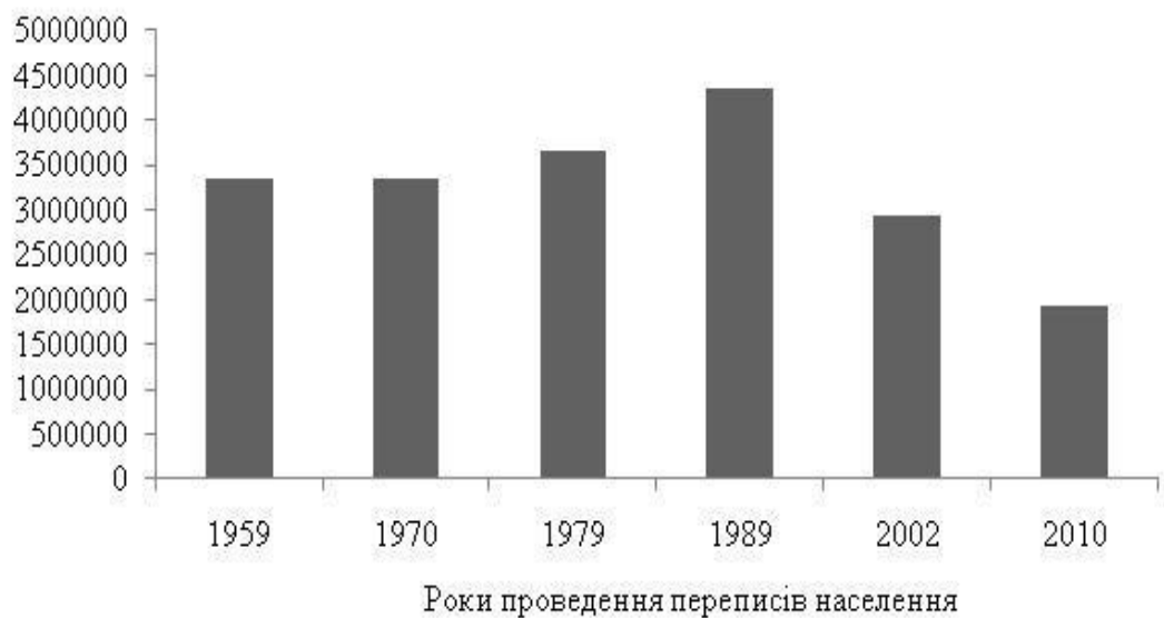
Рис. 1. Динаміка кількості українців в Росії за переписами 1959-2010 рр.

(з 1994 р.) призвело до зменшення числа українців, що поверталися на свою історичну батьківщину. Одночасно з тим відбувалися процеси активізації українців, які виїжджали до Росії, де економічна ситуація була кращою. Це призвело до формування потужних міграційних потоків у зворотному напрямку, і приблизно з другої половини 1990-х років і до теперішнього часу Україна є одним з джерел російського міграційного приросту [9, с. 94-95].