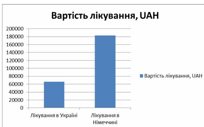
Рис. 3. Порівняння цінової стратегії лікування безпліддя в Україні та Німеччині [5]